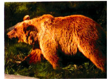
Braunbär in den Alpen.

La Catalogne offre de beaux paysages variés. Le nouvel Observatoire du paysage met à disposition du public des informations sur ce patrimoine de valeur.