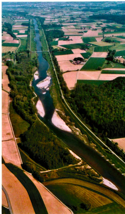
Die Thur bei Neunforn nach den Aufweitungsmassnahmen.

De plus en plus de gens vivent dans un environnement urbain et cherchent dans leurs loisirs la rencontre avec la nature. Cependant, l'état actuel de nos fleuves et rivières permet difficilement de