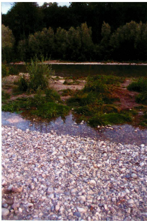
Sigrun Rohde (4)

Riche mosaïque de milieux naturels dans l'élargissement de l'Emme à Aefligen.