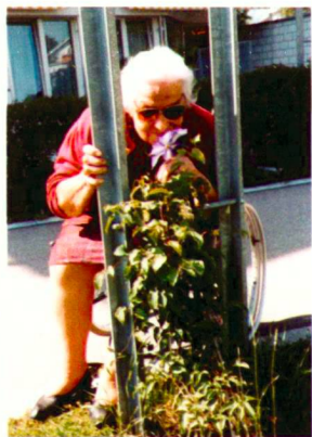
Ein lebendiges, sicheres Umfeld motiviert zum Aufenthalt im Freien.

Die Studie von Peter Kriesi zur Situation und möglichen Umgestaltung von Therapeutischen Aussenräumen für Autisten ist ausgesprochen kenntnisreich in einem wenig bekannten Bereich der therapeutischen Arbeit. Auch er erbrachte durch Befragung verschiedener Institutionen den Nachweis, dass Therapieräume gewünscht werden. Er entwickelte eine Übersicht über Grundmodule, die auf das jeweilige Krankheitsbild und die Therapie abgestimmt sind, und empfiehlt ein differenziertes Konzept von Räumen, in denen sehr kontrolliert die Reizmenge zunimmt (HSR, Abteilung Landschaftsarchitektur).