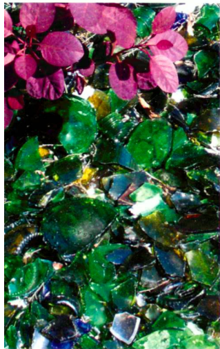
Pflanztröge aus glasfaser- verstärktem Kunststoff, abgedeckt mit einer Schicht aus gebrochenem Glas.

Des bacs à plantes en plastique renforcé de fibres de verre, recouverts d'une couche de verre concassé.