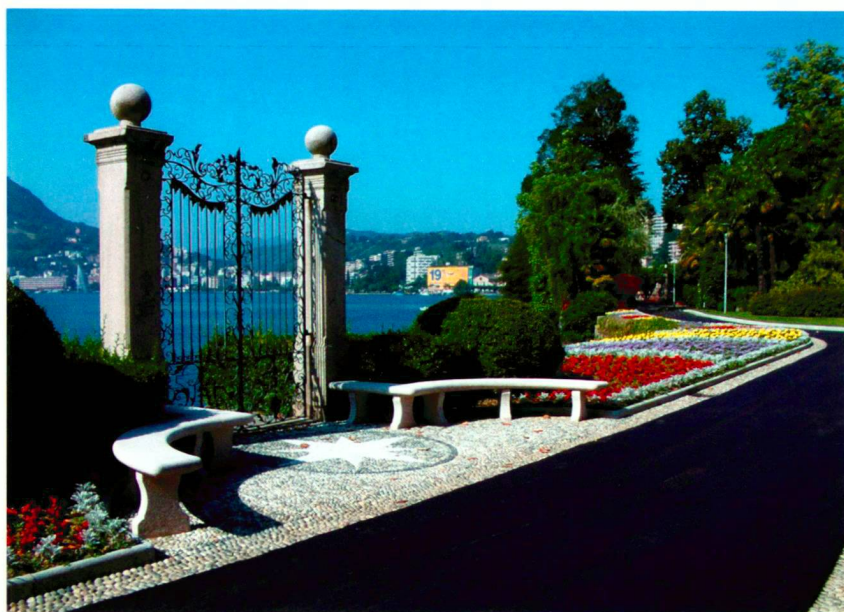
Detail des Eingangsportals vor der Sanierung (oben) und 2004 (unten).