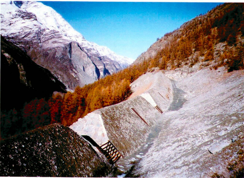
Bergsturz bei Randa, 1991.

Glissement de terrain près de Randa, 1991.