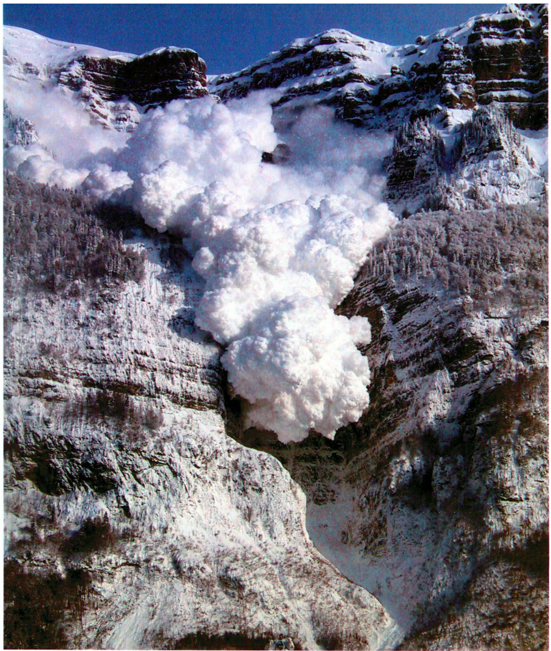
Die Schattenbachlawine bei Walenstadt SG.