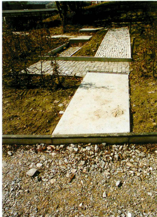
Der Gehgarten im Bau

Die therapeutischen Einrichtungen wurden in konzentrischen Ringen um die Klinik herum angelegt. Sie weisen unterschiedliche Eigen-