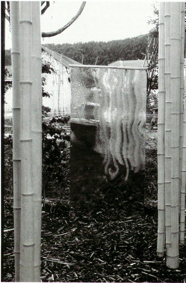
Festival de Jardins extraordinaires: «Tourmente sonore», Alessandro Lordelli, Jussy