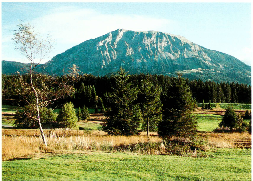
Moorlandschaft im Entlebuch