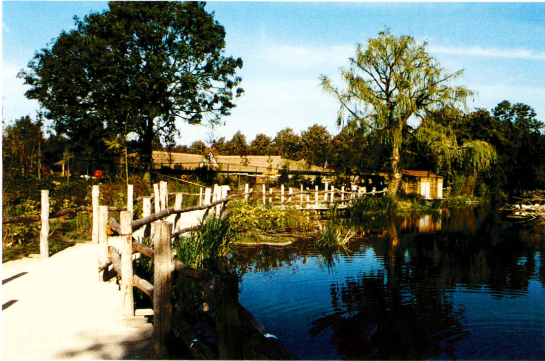
Steg zum malayischen Langhaus.