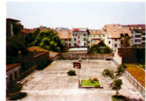
Auf diesem Dach entsteht ein ökologisch wertvoller Naturgarten – offen für die Bewohner.

Für Informationen zur Teilnahme an der Aktion «Das bessere Flachdach» wenden Sie sich bitte an den Gewerbeverband Basel-Stadt, Elisabethenstrasse 23, 4010 Basel, Telefon 061-271 02 88, Fax 061-272 62 25.