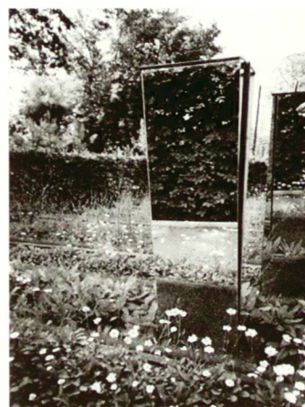
Le jardin de la ville de Lausanne

Un concours lancé par le Conservatoire International des Parcs et Jardins et du Paysage, créé en 1992 à l'initiative de la Région Centre de la France, offert aux paysagistes et aux étudiants, soutenus par leur école, 20 parcelles d'environ 240 m 2 à réaliser sur le thème «la technique est-elle poétiquement correcte?», avec un budget de 20 000 à 80 000 FF au