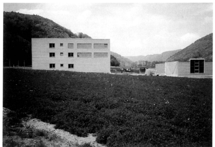
Construction outline struts instead of fruit trees on the village outskirts, commercial structures in the familiar meadowed valley influence referenda, but not actions yet.