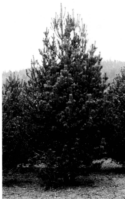
Pinus uncinata , etwa 25jährig.

Puzzy-Boy beseitigt Beikraut und Wildwuchs giftfrei, geräuschlos und ohne offene Flamme. Durch den kontrollierten Entzündungsprozess von Flüssiggas (Propan oder Butan) wird in den keramischen PB-Pyro-Elementen eine Temperatur von 1100 °C erzeugt. Dank der patentierten PB-Thermoschürze trifft diese intensive Infrarot-Strahlung gezielt auf das Beikraut und Flugsamen, bringt deren Eiweiss-Zellen zum Platzen und leitet so umgehend den Verwelkungsprozess ein. Anders als beim Jäten und beim Chemieeinsatz zerstört die Strahlung gleichzeitig auch die angetriebenen Flugsamen. Und da die Infrarot-Strahlung nicht mehr als 1 bis 2 mm in den Boden eindringen kann, erfolgt dabei, gemässe der Publikation «Abflamntechnik» von Prof. Dr. M. Hoffmann, Technische Fachhochschule Weihenstephan-Triesdorf, auch keinerlei Beeinträchtigung der Mikrolebewesen in der Erdoberfläche.