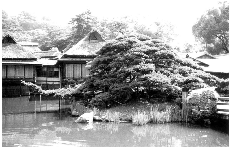
On ne garde que les premières aiguilles des repous-ses; jardinier expérimenté en train de tailler des pins ( à gauche ). Magnifique "matsu" (pin en jap.) sur une île devant une maison de thé dans le jardin de Genkyu-en à Hikone; aménagé vers 1677 sous Lord Naooki-Ii ( à droite ).