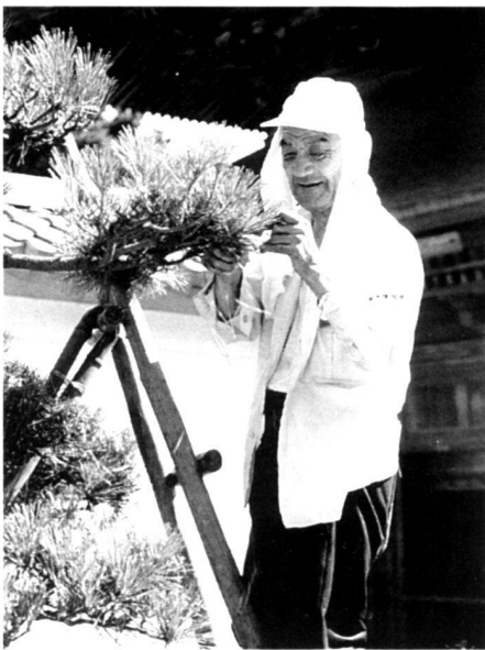
Nur die vordersten Nadeln des Neuaustriebes bleiben stehen; erfahrener Gärtner beim Föhrenschnitt ( links ). Wunderschöne alte Matsu (Föhre, jap.) auf einer Insel vor einem Teehaus im Genkyu-en Garten in Hikone; gebaut um 1677 unter Lord Naooki Ii ( rechts ).