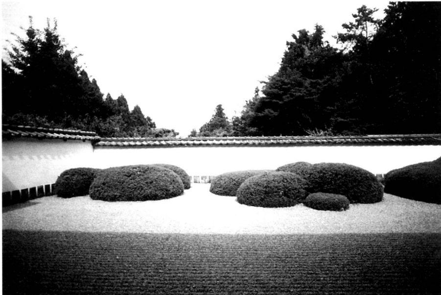
Trockenlandschaftsgarten mit «geborgter» Aussicht auf Mt. Hiei; Bild im Vordergrund: Löwin, die mit ihren Jungen den Fluss überquert (drei, fünf und sieben Azaleen in Gruppen); Shodenji Tempel, Kyoto.

Pruned azaleas are used, for example, to stage rolling, surging panoramas. Individual shrubs (or groups) also pruned to spherical shapes are often used close to dwellings. A very exact pruned shape is important here. The shoots are removed by hand or using electric shears and then brushed down with birch brooms.