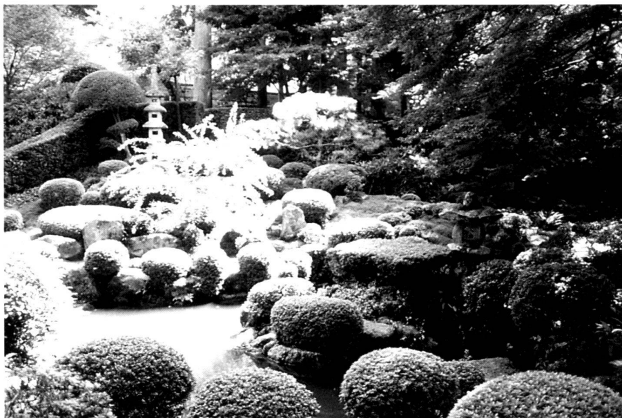
Rundlich geschnittene Azaleen um eine Quelle; Shuheki-en (Teil des Sanzen-in), Kyoto-Ohara.

Dry landscape garden with "borrowed" view of Mt. Hiei; picture in the foreground: lioness with her cubs crossing the river (three, five and seven azaleas in groups); Shodenji Temple, Kyoto.