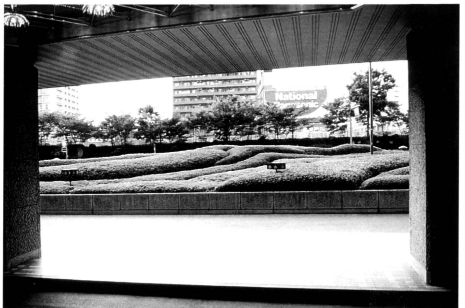
An undulating landscape of pruned azaleas ( Rhododendron indicum ); entrance area of the Royal Hotel in Osaka by Yoshikuni Araki, 1973.