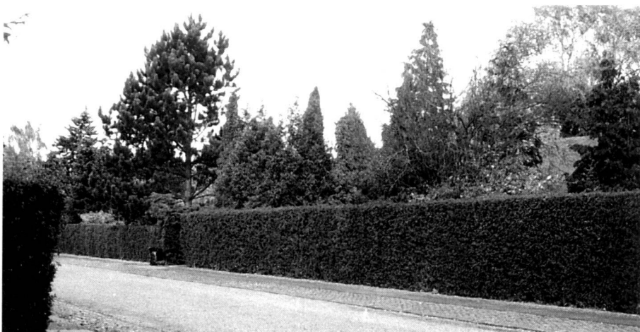
Une haie d'épine bien taillée, plantée dans les années 30 et toujours bien en forme dans les années 60 ( à gauche ).

Au début du 20 e siècle, le néoclassicisme conquiert le Danemark et les autres pays scandinaves. Les haies entrèrent de nouveau dans les parcs urbains, les jardins et sur les places. La plus connue de ces haies est probablement celle de «Krinsen» à Kongens Nytorv. Après une interruption de 170 ans, la nouvelle haie d'ormes, plantée en 1916, est actuellement remplacée.