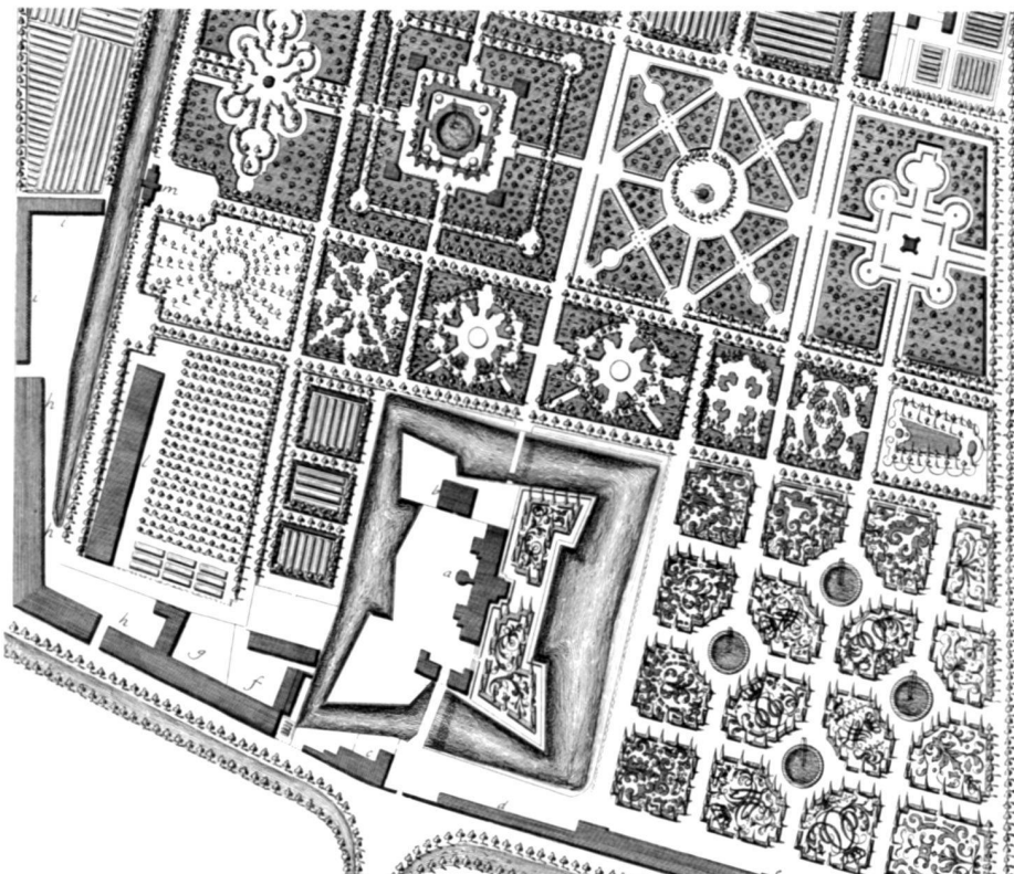
Ausschnitt aus dem Parterre im Rosenburger Schlossgarten in Kopenhagen, entworfen von J. C. Krieger in den 30er Jahren des 18. Jahrhunderts. Ein Kupferstich aus «The Danish Vitruvius», 1746.

A number of engravings bear witness to the use of form-trimmed growths during this period. However, the baroque garden concept was given a specific Danish expression. The king's ornamental Buxus monogram marked the introduction of the "parterre de broderie". Krieger's bosquets invariably included a hedge maze and an open air theatre with hedge wings. The numerous projects for royal gardens attributed to J. C. Krieger show a marked use of small cone or pyramid shaped evergreen trees or shrubs – probably Taxus or Picea .