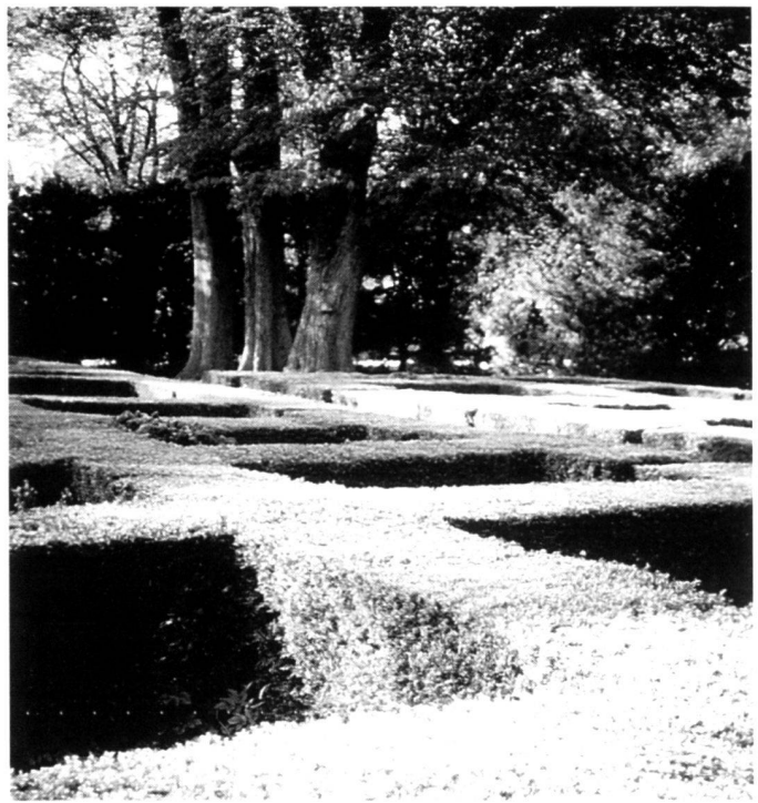
Vestre Kirkegaard, à la Grecque pattern between small urn plots ( left ).

Mariebjerg-Friedhof. Ein traditionell gestalteter Bereich mit beschnittenen Taxus-Hecken nach den Plänen von G. N. Brandt ( rechts ).