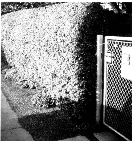
Eine sauber geschnittene Crataegus-Hecke, gepflanzt in den 30er Jahren und immer noch gut in Form in den 60ern ( links ).

Anfang des 20. Jahrhunderts eroberte der Neoklassizismus Dänemark und die übrigen skandinavischen Länder, worauf die