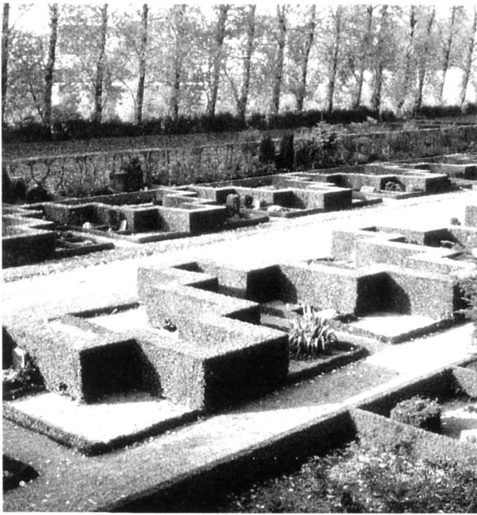
Vestre-Friedhof. «A la Grecque»-Hecken zwischen kleinen Urnengräbern ( links ).

Mariebjerg-Friedhof. Ein traditionell gestalteter Bereich mit beschnittenen Taxus-Hecken nach den Plänen von G. N. Brandt ( rechts ).