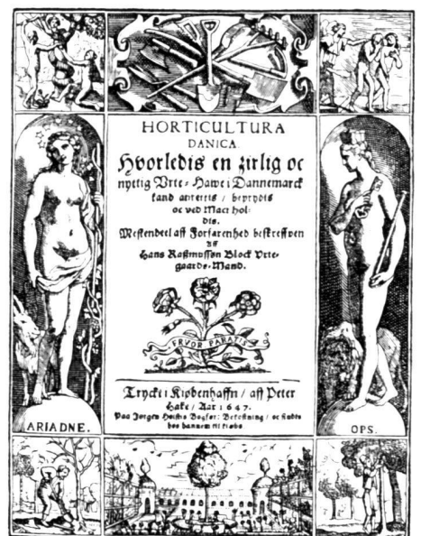
Die Titelseite des ältesten dänischen Gartenbuchs. Oben eine Auswahl von Gartengeräten.

The title page of Denmark's oldest gardening book, from 1647, shows a collection of garden tools very similar to those used today. Hans Rasmusson Block wrote the book, entitled « Horticultura Danica », on «How to lay out a neat and useful orchard, decorate it and maintain it». The second chapter instructs the reader to use garden line, when cutting the paths, i.e. the bordering hedges, to prevent them from curving. As for Buxus hedgings, they should be trimmed twice, in spring and right after the dogdays – and immediately after full moon – to keep them no taller or wider than three fingers. The third chapter deals with gardening tools, including shears and sickle. Apart from Buxus, the book mentions hedges planted with Crataegus, and the need to