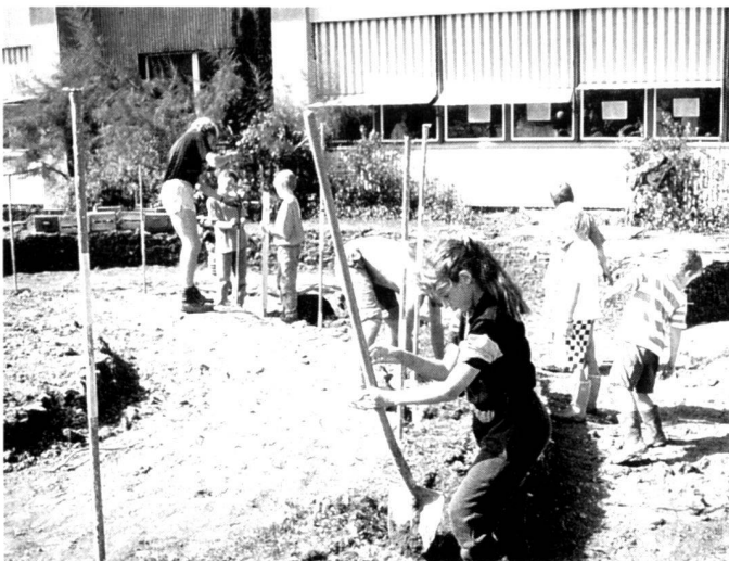
Bauen einer Rasensodenbank im Schulhaus Saatlén.

It has turned out that redesigning the grounds of a school triggers off a great deal among those involved. If the ideas of the project are accepted, to perceive or even support nature outside the front door, then changes can also take place at other locations to create adventure, natural open spaces. The «Nature around the schoolhouse» project is thus also a project for the development of a local area and an introduction to self help.