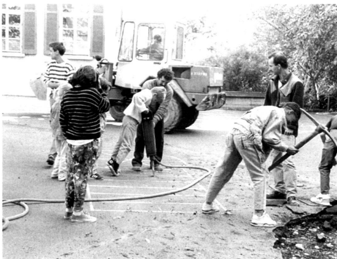
Kinder entsiegeln den Boden (links) und pflanzen Bäume (rechts), Schulhaus Seefeld.