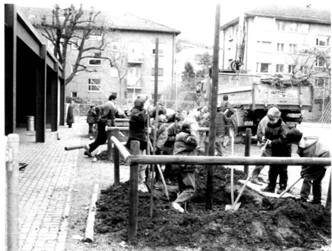
Des enfants descellent le sol (à gauche) et plantent des arbres (à droite), collège Seefeld.