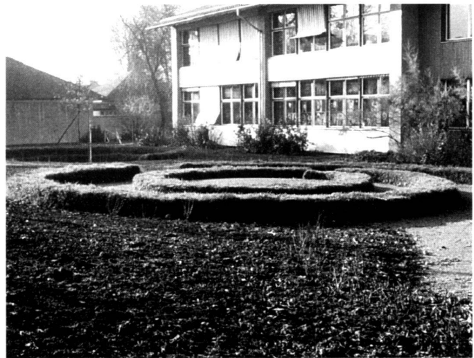
Construction of a turf bench in Saatlén school house.