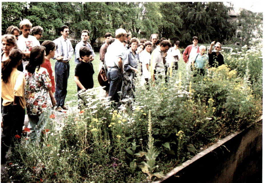
Hofacker school house: teachers and other interested parties viewing the beds of wild herbageous plants.