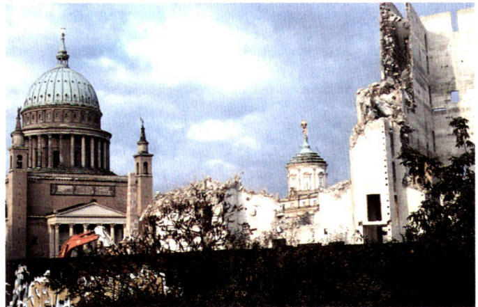
Rêves de Potsdam: Ferdinand von Arnim, Belvédère sur le Pfingstberg, projet, 1856 (à gauche), le Dôme et l'ancien Hôtel de Ville avec le théâtre abandonné, resté inachevé, 1992 (à droite).