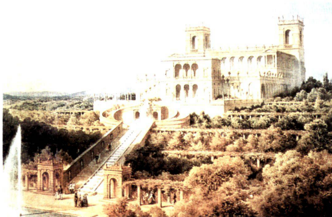
Potsdamer Träume: Ferdinand von Arnim, Belvedere auf dem Pfingstberg. Projekt 1856 (links), Dom und altes Rathaus mit abgebrochenem, nicht vollendetem Theaterbau, 1992 (rechts).

In the draft landscape plan for the north-