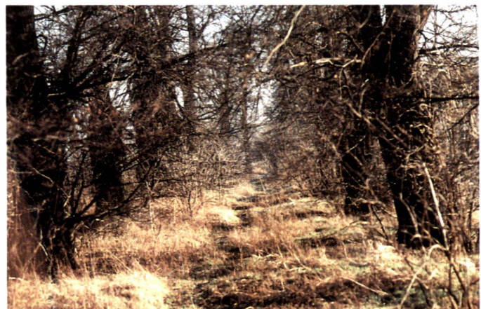
Paysage de Potsdam: Vers 1850, Lenné agrémenta les terres de Bornim. Aujourd'hui encore, d'imposantes allées – pour la plupart détruites – strient le paysage.