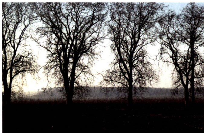
Potsdamer Landschaft: Um 1850 wurde von Lenné die Bornimer Feldflur «aufgeschmückt». Noch heute durchziehen mächtige, z. T. aber ruinierte Alleen die Landschaft.