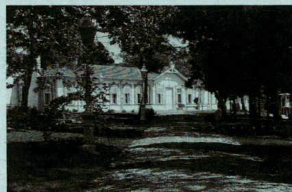
Prix Aga Khan d'Architecture 1992: Programme de réhabilitation des parcs et palais d'Istanbul/Turquie. Client: La Grande Assemblée Nationale Turque, Ankara. Conservateurs et architectes: Bureau régional de la Fondation des palais nationaux, Istanbul. Palais de Dolmabahce, les jardins.