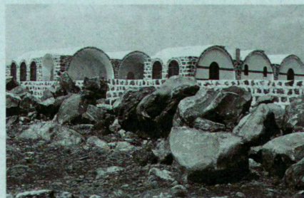
Prix Aga Khan d'Architecture 1992: Système de construction en pierre. Client: Ministère de l'Education, Damas, Syrie. Architectes: Raif Muhanna, Ziad Muhanna et Rafi Muhanna. Les bâtiments ainsi construits coûtent un tiers moins cher comparés aux méthodes traditionnelles de construction.