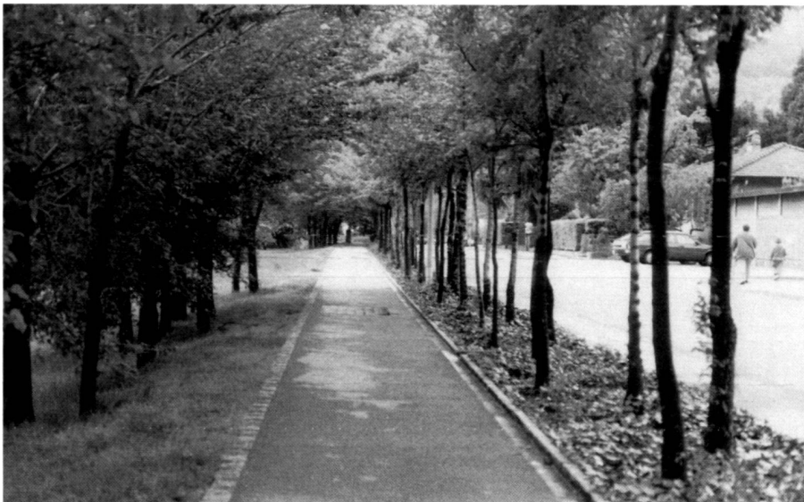
Rinverdimento rete stradale a Bellinzona, 1982. Progetto P. Bürgi.

Dans le même temps, la circulation individuelle devenait un phénomène de masse d'une ampleur énorme. La nécessité d'adapter la ville aux besoins croissants de mobilité individuelle est devenue le sujet politique numéro un. Les rangées d'arbres des allées ont été transformées en voies de circulation et les surfaces engagées ont dû céder la place aux par-