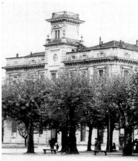
Verde urbano a Locarno, ca. 1930.