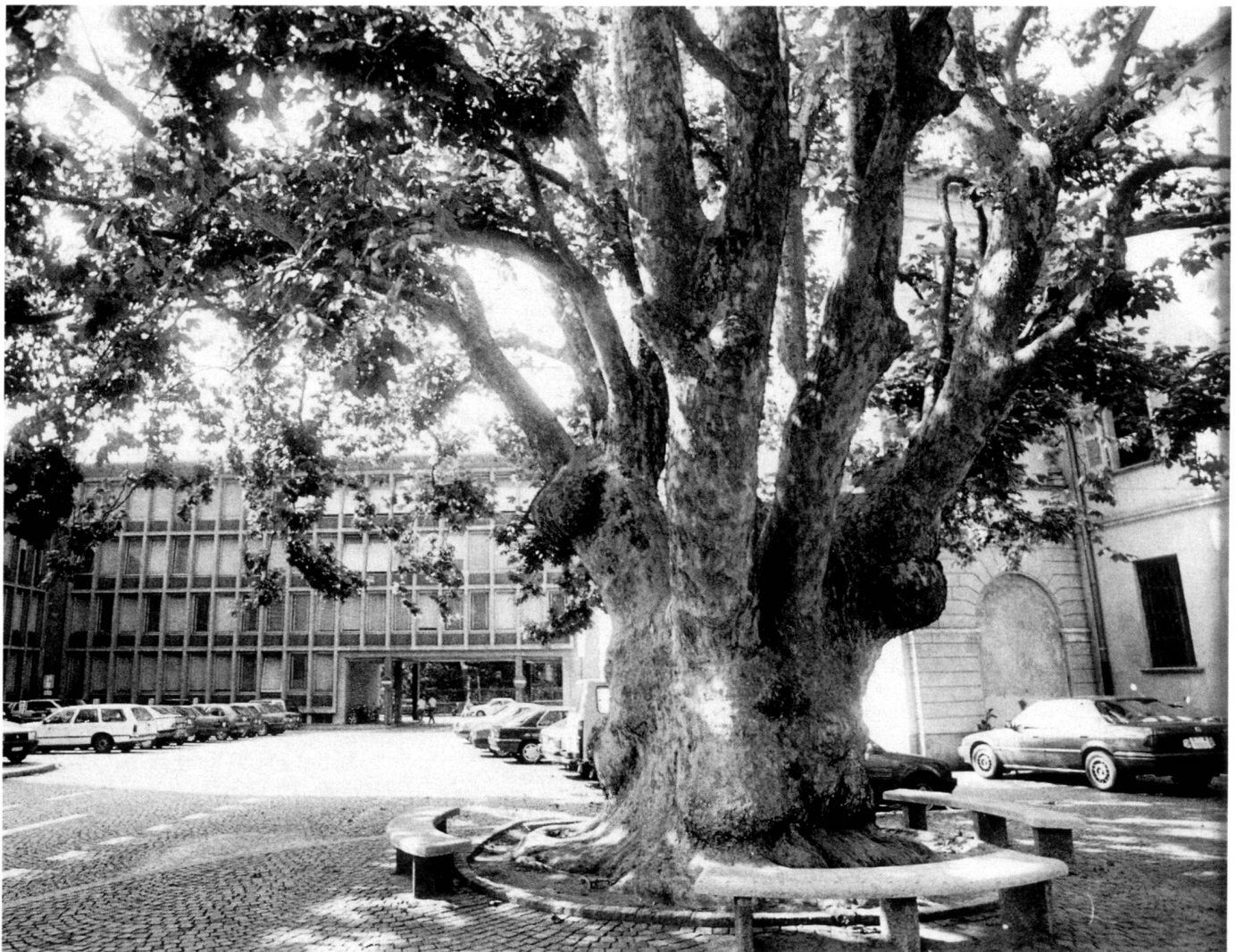
L'albero quale presenza episodica.

Ce n'est que tout récemment que quelques jardins privés ont été rachetés par le secteur public. On pourrait à juste titre signaler que cette argumentation ne vaut que pour les régions qui relèvent de la ville au sens traditionnel, mais que depuis les années 60, la part d'espaces verts a considérablement augmenté dans les nouveaux quartiers et dans les communes des agglomérations. Cela n'est toutefois vrai que sur le plan quantitatif, reste limité