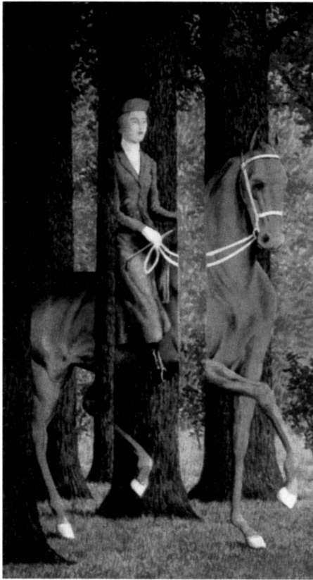
René Magritte: Le Blanc-Seing, 1965.