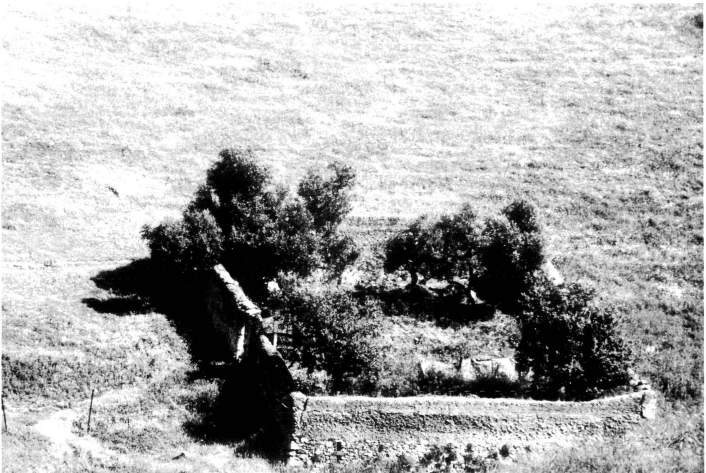
Ur-Typus des Gartens in der andalusischen Weidelandschaft.

The first indication is already given by the term, diametrically opposed forces are at work between the garden and nature. Garden designates a piece of land enclosed by switches, it represents one of the oldest cultural achievements. By means of his fence, Man separates his garden from the access of nature. Wilderness is kept out, plants are divided into useful herbs and weeds, natural conditions are ameliorated.