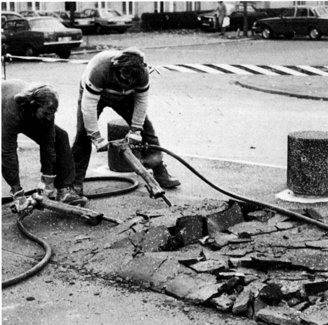
Links: Enttönerungsaktion mit Anwohnern der Diakonissenstrasse zur Pflanzung von acht Platanen.