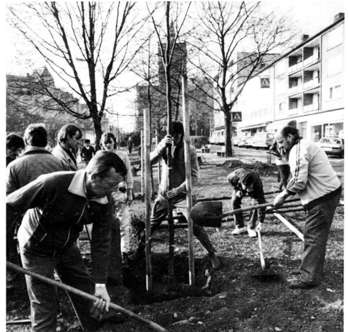
Left: Removing of the asphalt surface by residents in the Diakonissenstrasse prior to the planting of eight plane trees.