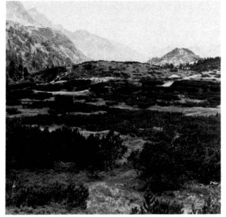
Landschaft durch Latschenbulte gegliedert, Kleinräume und spezifische Biotope (Flachmoore, Quellsümpfe).

Développement des marais: Une condition décisive pour la formation des marais est la pauvreté des substances nutritives, respectivement des minéraux dans l'eau baignant les mousses. Les substances nourricières du sol et de l'eau de fond sont