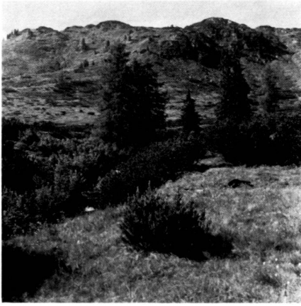
Zwischenmoor-Standort mit einzelnen Latschen und Baumgruppen, links tief eingeschnittener Taurachlauf, Hintergrund Sonnenköpfe.

Habitat d'un marais en voie de formation avec quelques aulnes verts isolés et bosquets, à gauche le lit profondément creusé de la Taurach, à l'arrière-plan des crêtes de «Sonnenköpfe».