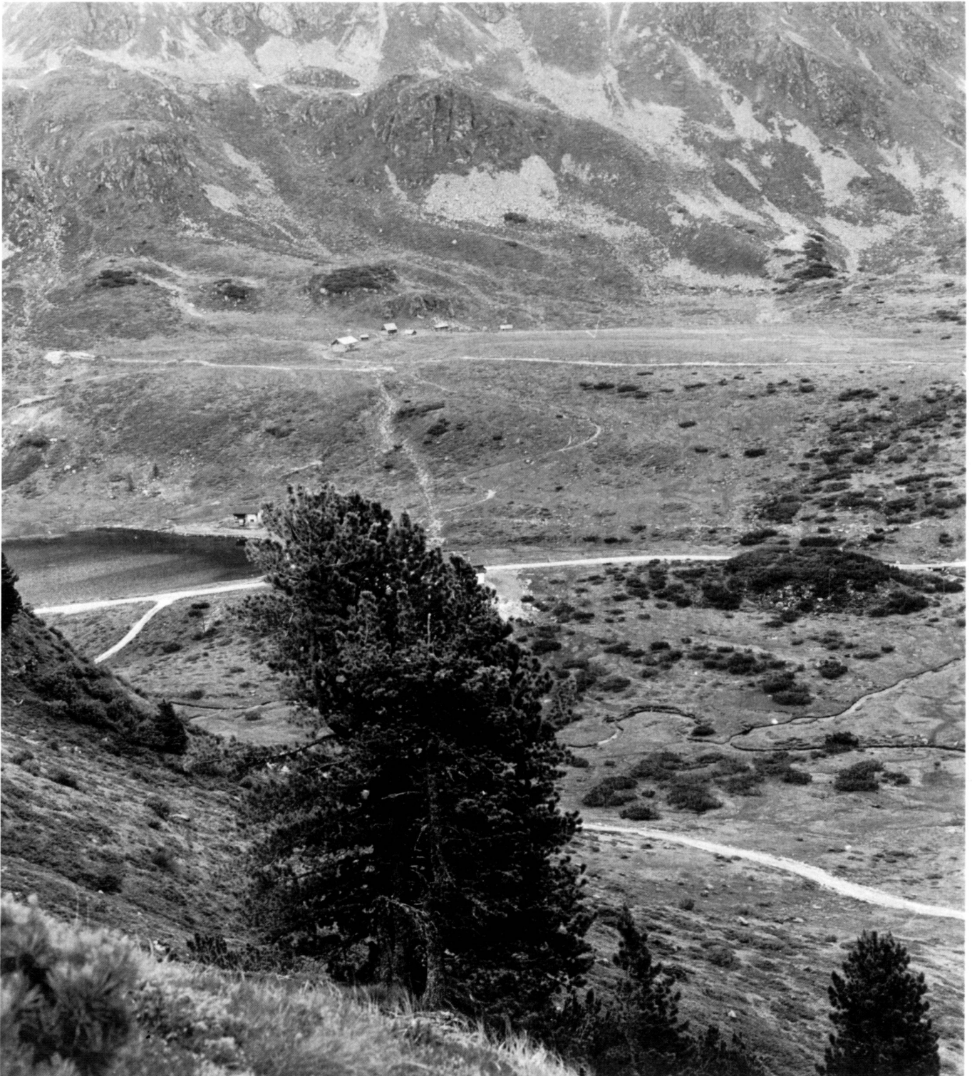
Blick vom Sonnenhang gegen Plattenhang, Hundsfeld-see. Grosse Sensibilität der Naturformen gegen Eingriffe erkennbar.