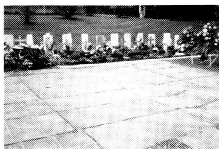
Rasenschutzmatten für den Friedhof.

Die Rasenschutzmatten, welche auch in der Grösse 33 x 33 cm erhältlich sind, können als