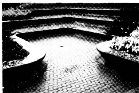
Anwendungsbeispiel für Papillon-Elemente.