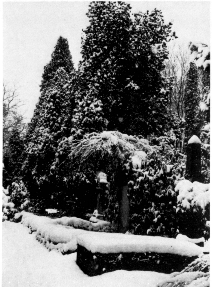
Illustrations pages 21–23: Vues du cimetière hors service Steig à Schaffhouse qui, heureusement, est conservé comme site historique – vestige d'un vieux jardin des morts.