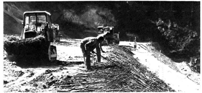
Bauen mit lebenden Pflanzen

Die INTERGREEN ® löst Begrünungsaufgaben in der Landschaft im Hydrosa-Verdyol-Verfahren