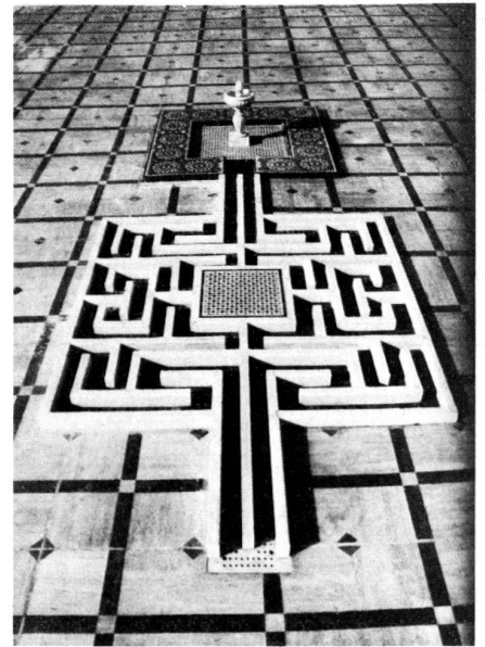
Labyrinth-Brunnen im Königspalast in Marrakesch.

Und zum Begriff der «mallems» lesen wir weiter: «Pour assurer l'authenticité de cet ouvrage, nous avons bénéficié non seulement des documents photographiques présentés, mais de la collaboration spontanée des mallems de chaque discipline artisanale. – Le malleme est 'l'homme qui sait', 'le Maître' comme pouvait l'être Léonard de Vinci ou Michel-Ange. Le malleme est incontesté, il règne sur sa profession. L'apprenti, ou mataalleme (celui qui apprend), le vénère.»