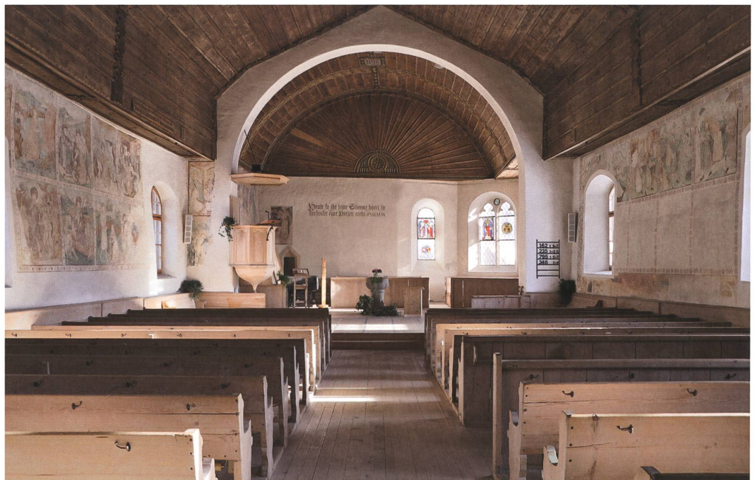
Abb. 4: Zweisimmen, Kirche. Das Kircheninnere mit Blick gegen den Chor. Sichtbar ist der Chorbogen von 1439d (Phase braun) und links dahinter der Südabschluss des Chors von 1491i (Phase olive). Blick gegen Osten.

Grössere Umbauten erfuhr die Kirche im Laufe des 15. Jahrhunderts (Abb. 2, Bauphase braun). Damals entstand der heutige Dachstuhl