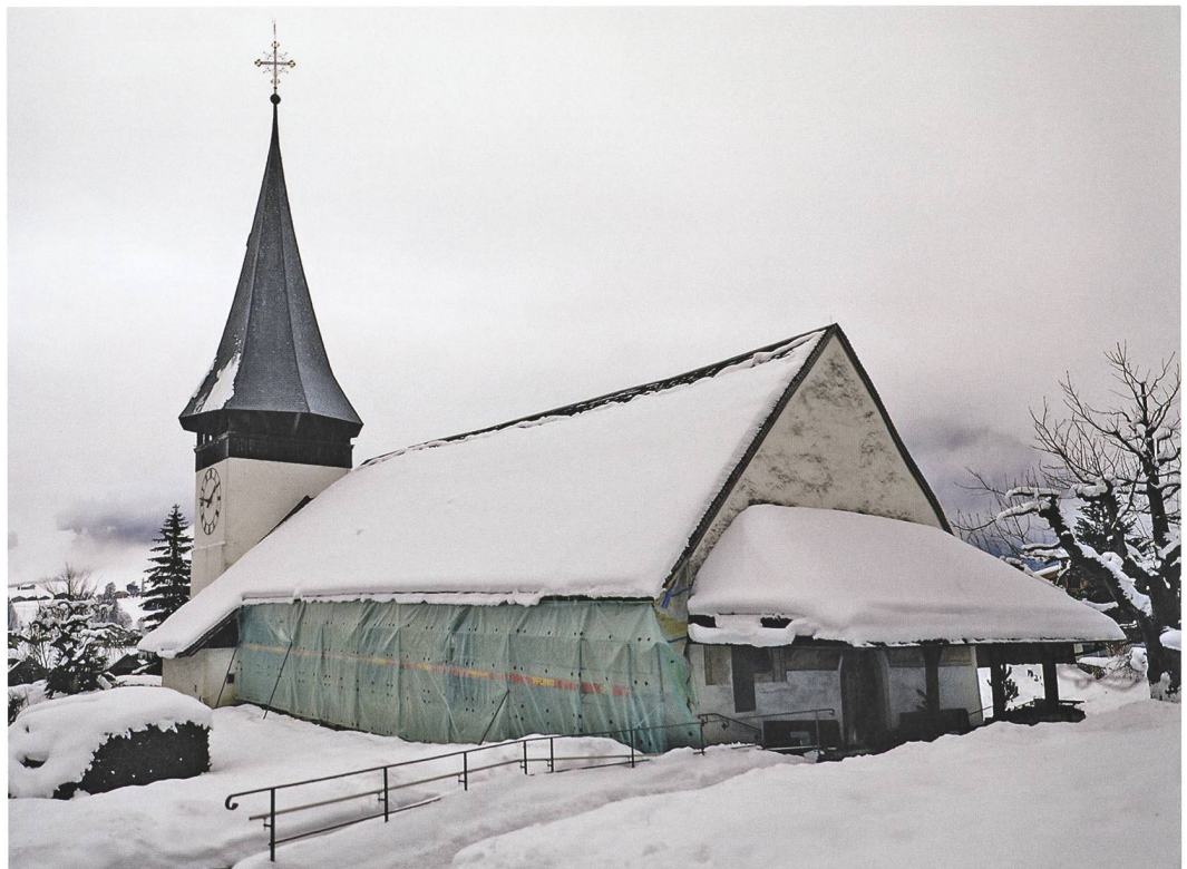
Abb. 1: Zweisimmen, Kirche. Unter dem Witterschutz konnte die Nordfassade des Langhauses untersucht werden. Blick nach Südosten.

Erste Hinweise, dass sich bereits vor der ersten Erwähnung einer Kirche am Ort der heutigen ein Gotteshaus befand, lieferten Schürfungegen im Boden des Kircheninnern in den Jahren 1956/57, die nicht genauer bestimmbare Mauerzüge zum Vorschein gebracht hatten. Das Vorhandensein älterer Bauteile haben nun auch die Untersuchungen im Winter 2019/20 bestätigt: Bei der Entfernung des modernen Verputzes an der Nordwand des spätgotischen Bauwerks zeigte sich, dass diese die noch komplett erhaltene Nordmauer einer älteren Kirche enthielt (Abb. 2, Bauphase rot). Dieses Gotteshaus war weniger hoch und erstreckte sich weniger weit