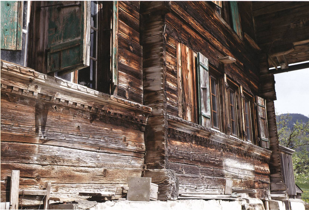
Abb. 6: Aeschi b. Spiez, Suldhaltenstrasse 31. Die 1779 erneuerten Reihenfenster auf der Westseite des Stubengeschoßes. Typisch für den Holzbau dieser Zeit sind in der Region reich profilierte und mit Flachschnitzereien verzierte Brüstungs- und Sturzhölzer um die Fensterzone der Wohnräume. Die heute stark verwitterten Hölzer dürften ehemals noch bunt bemalt gewesen sein. Blick nach Süden.

ten Südwestecke des Gebäudes. Auch die Hölzer von 1779 sind inzwischen wieder stark verwittert. Den Umbau nutzte man zugleich zu einer Vergrößerung des Wohnraums, indem man die Nebenstube um etwa 1,80 m nach Norden verbreiterte. Der Raum springt seitdem mit seinen Blockwänden in den Heuboden der Ökonomie vor (Abb. 7). Wegen statischer Probleme wurde der vorkragende Abschnitt im Stall nachträglich durch Stützen und Unterzüge gesichert.