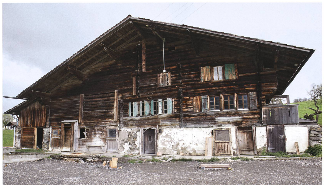
Abb. 1: Aeschi b. Spiez, Suldhaltenstrasse 31. Westfassade an der Suldhaltenstrasse, rechts der Wohnteil mit der 1779 ausgewechselten Wohnstube und links die seitlich angeordnete vergrösserte Ökonomie von 1849.

Die westliche Hauptfassade ist wenige Meter von der Suldhaltenstrasse zurückgesetzt. Der Wohnteil mit der über Eck angeordneten Wohnstube und der nördlich angrenzenden Nebenstube (Abb. 1, 2 und 4) ist in der Fassade heute durch jüngere grosse Reihenfenster,