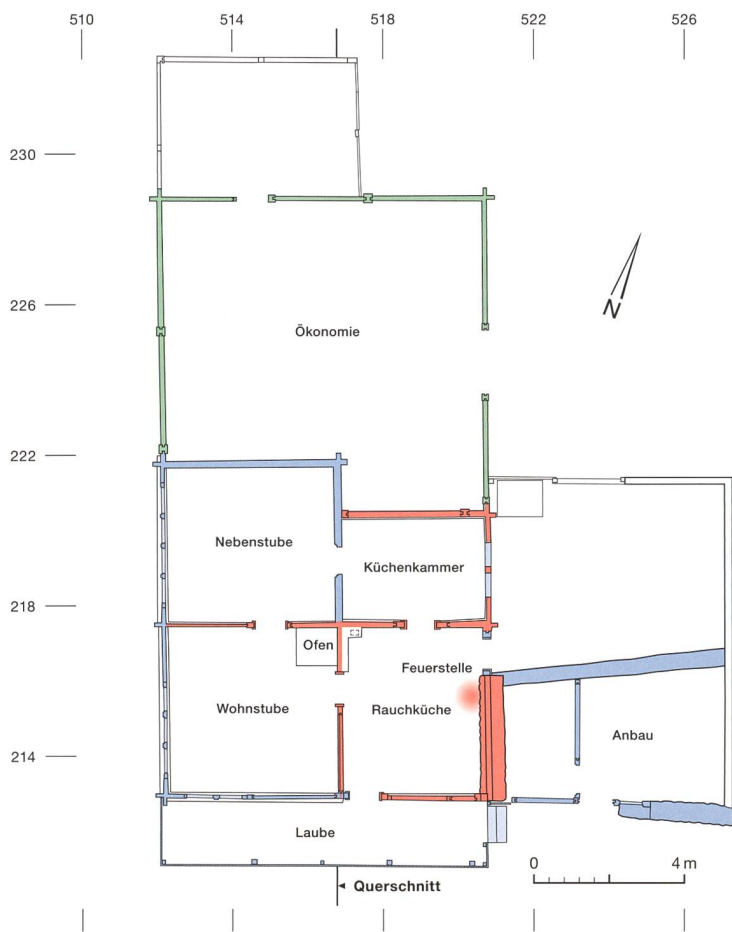
Abb. 4: Aeschi b. Spiez, Suldhaltenstrasse 31. Grundrissplan zum Erdgeschoss. Gut zu erkennen ist die 1779 vergrösserte Nebenstube, die nach Norden in die Ökonomie vorspringt. M. 1:200.

der heutigen Zugangslaube im Süden erst im 18. Jahrhunderts entstanden sein dürfte (Abb. 4, blau). Der unten näher beschriebene umfassende Umbau des Kernbaus fand in den Jahren ab 1779 statt. Damals waren offenbar auch auf der Höhe des Gadengeschosses in der Rauchküche Veränderungen geplant, die aber nicht ausgeführt wurden (Abb. 3, lila). Strichförmige Markierungen an den Innenseiten der dortigen