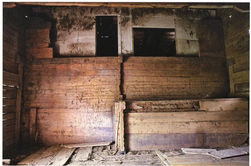
Abb. 7: Aeschi b. Spiez, Suldhaltenstrasse 31. Nordfassade des Wohnteils vom Heuboden aus gesehen. Die Blockkonstruktion der Nebenstube von 1779 springt in die Ökonomie vor. Darüber liegt die durchlaufende Blockwand zum Gaden des Ursprungsbaus von 1559. Hier auf ruhen wiederum die Enden der Blockvorstösse der 1849 neu angefügten grösseren Ökonomie.

Der spätbarocke Umbau des Wohnteils prägt heute das Bauernhaus. Von der ursprünglichen Fenstergliederung und den im Stubengeschoß schon damals anzunehmenden Zierelementen ist nichts mehr erhalten geblieben. Einzig die im Stil des 15./16. Jahrhunderts profilierten Enden der Pfetten stammen noch vom Bauschmuck des Ursprungsgebäudes.