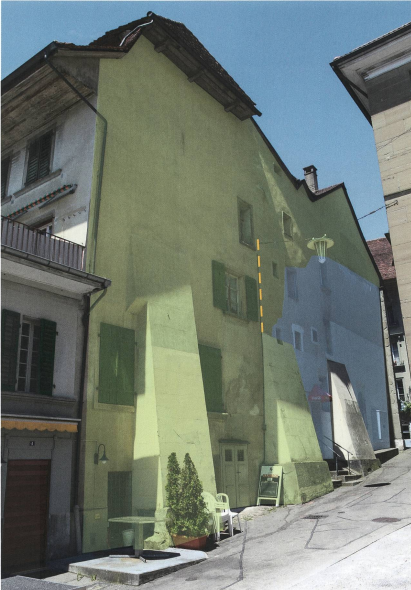
Abb. 4: Burgdorf, Schmiedengasse 1. Ansicht der Ostfassade. Orange gestrichelt: Lage des östlichen Abschlusses der ehemaligen Südfassade nach 1200; blau eingefärbt: die noch in Teilen erhaltene Fassade aus dem frühen 15. Jahrhundert; grün eingefärbt: der Neubau nach dem Brand von 1706.