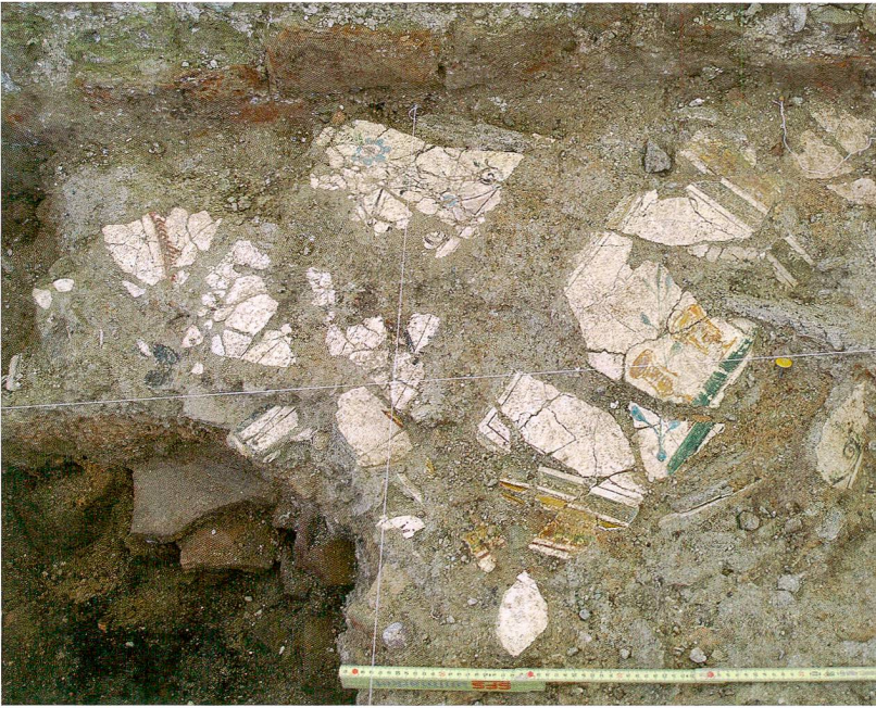
Abb. 2: Kallnach, Hinterfeld. Bemalter Verputz der exedra in Fundlage.