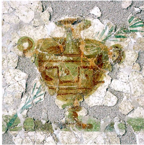
Abb. 5: Narbonne, Clos de la Lombarde. Hydria und Siegespalme auf der Deckenmalerei des Raumes H.

Die dekorierte exedra gehörte zur palaestra des Thermenkomplexes. Die axiale Öffnung der exedra zum Hof sowie sein Dekor unterstützen diese Interpretation. Eine vergleichbare, jedoch halb so grosse (8,5 × 16,5 m) palaestra wurde in den Thermen der Villa von Orbe-Boscéaz VD entdeckt; sie grenzte an drei Räume, von denen der grösste axial ausgerichtet ist.