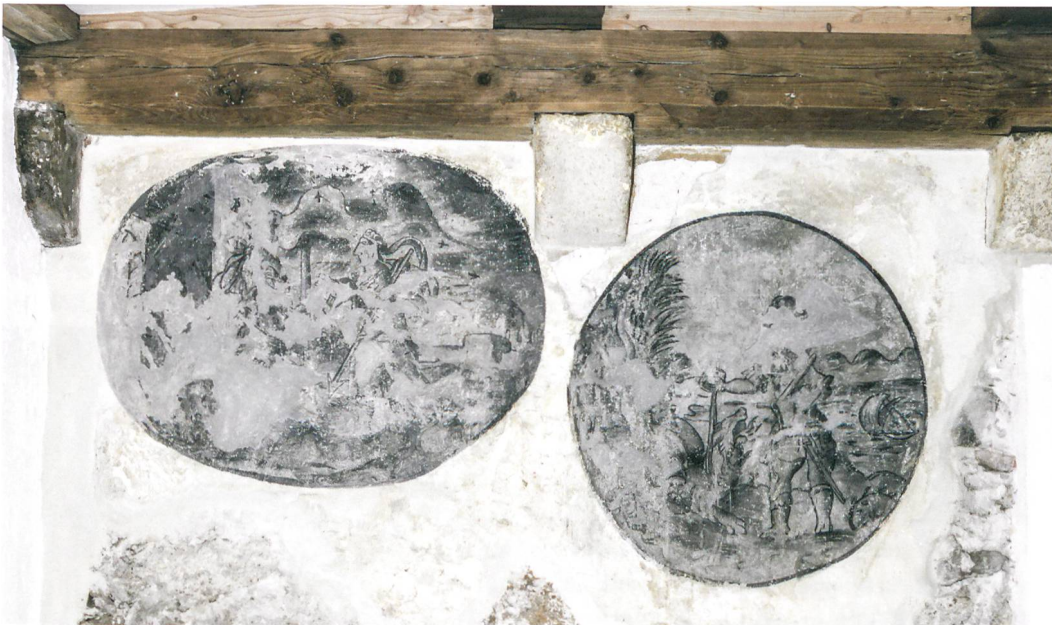
Abb. 5: Biel, Obergasse 13. Grisaille-Malerei mit der Darstellung der Geschichte von Kephalos und Prokris und Jason, der den Drachen mit Gift beträufelt aus den Metamorphosen von Ovid. Restaurierung Hans-Jörg Gerber, Nidau.