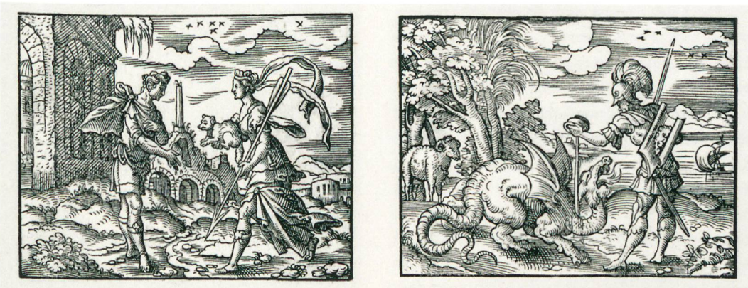
Abb. 6: Holzschnittillustrationen von Virgil Solis aus den von Johann Spreng 1562 herausgegebenen Metamorphosen von Ovid. Höchstwahrscheinlich dienten die Holzschnitte als Vorlage für die Grisaille-Malereien im Bieler Bürgerhaus.

Als Vorlage dienten dem Maler offenbar die Illustrationen der Frankfurter Ausgabe der Metamorphosen, die von Johann Spreng 1562 herausgegeben und mit Holzschnitten von Virgil Solis versehen wurde (Abb. 6).