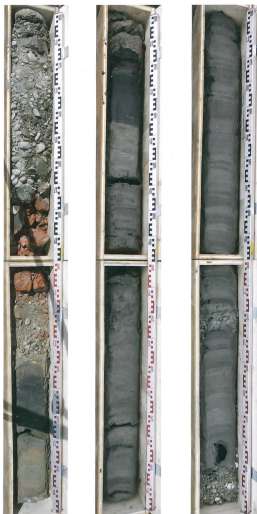
Abb. 1: Biel, Feldschlössliareal. Bohrkern 3037 mit der Schichtabfolge von der modernen Aufschüttung (links oben) bis in die Mittelsteinzeit (rechts unten).

Basierend auf den Ergebnissen der Bohrsondierungen wurden zusätzlich 12 Sondierschnitte mit dem Bagger angelegt. Die Schnitte erreichten eine Tiefe von bis zu 5,7 m. Damit wurde versucht, die Resultate der Bohrungen zu verifizieren.