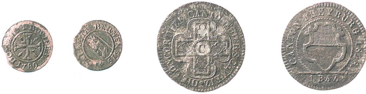
Abb. 6: Urtenen, Solothurnstrasse 53, zwei Münzen der Zeit um 1800 aus der Verfüllung zum Anbau von Phase 5a im südöstlichen Eckbereich der Wirtsstube.

Obergeschoss hingegen nur über eine Laube auf der östlichen Traufseite. Ein innenliegendes Treppenhaus gab es noch nicht. Das Erdgeschoss war bereits ähnlich gegliedert wie heute. An die Stube grenzte im Norden die Küche. Dahinter lag wiederum ein Wohnraum, vielleicht die Stube beziehungsweise Schlafkammer der Wirtsfamilie. Das Obergeschoss könnte ebenfalls schon auf der Südseite mit einer grossen Stube, einem Gastsaal, ausgestattet gewesen sein. Davor bestand wohl schon eine Laube. Rückseitig sind zwei Gästekammern anzunehmen.