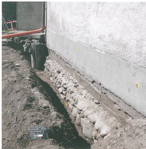
Abb. 3: Koppigen, Hauptstrasse 3. Ostseite des Hauptchores mit dem freigelegten Feldsteinfundament. Blick nach Süden.

Spiegelt sich diese Bausituation etwa in der Gründungssage der Kirche wider? Dort ist vom Streit beider Parteien die Rede. Thorberger und Koppiger konnten sich demnach nicht auf einen Bauplatz einigen. Die einen wollten die Kirche bei der ehemaligen Burgstelle errichten, die anderen bevorzugten einen Neubau im «Ruinenfeld des Römerturms», wie es heisst. Mehrfach legte man den Grundstein auf der Burg, doch wie von Geisterhand gelangte dieser auf das Ruinenfeld zurück. So fiel der Sage nach die Wahl schliesslich auf diesen Bauplatz im Dorf. Wenngleich die Sage gewiss nicht wörtlich zu nehmen ist, so verbirgt sich darin ein wahrer Kern. Immer wieder ist in den Schriftquellen vom Streit beider Parteien zu lesen, so etwa um 1417, als umfangreiche Baumassnahmen stattfanden.