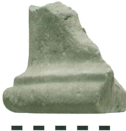
Abb. 1: Roggwil, Fryburg. Römisches Säulenfragment aus Marmor (Finder: H. Schürch, Roggwil).

Ein neues Kapitel in der Erforschung der «Fryburg», wie der Flurname des Freiburgfelds heute offiziell lautet, begann 1989 mit dem Fund eines römischen Säulenfragments am Kilchweg. Dieses gelangte 2006 in den Archäologischen Dienst (Abb. 1). In der Folge wurden Erdarbeiten in der Umgebung regelmässig archäologisch überwacht, allerdings zunächst erfolglos: Die gesuchte römische Siedlung konnte nicht lokalisiert werden. Erst die Meldung, dass in einer Baugrube am Ahornweg eine schwarze Schicht zu sehen sei, löste 2008 eine erste Notgrabung aus. Dabei konn-