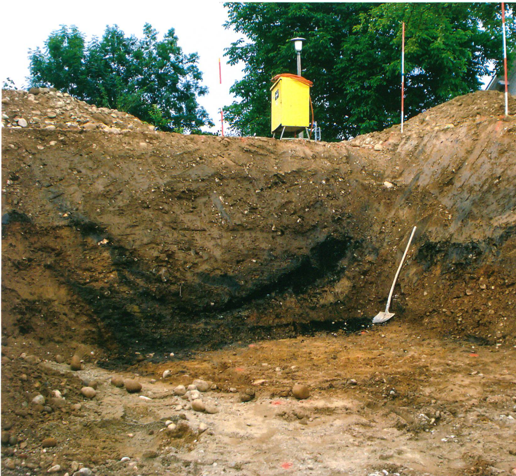
Abb. 2: Roggwil, Fryburg. Latènezeitliche Grube mit Brandschutt in einem Baugrubenprofil am Ahornweg.

ten die Reste einer vom Bau bereits teilweise zerstörten Grube von rund 7,5 × 6 m Grösse und 2,5 m Tiefe untersucht werden (Abb. 2). Die Grube unbekannter Funktion wurde offensichtlich nach ihrem Auflassen als Abfalldeponie genutzt und enthielt Siedlungs- und Brandschutt mit zahlreichen Funden, vorwiegend Keramik aus der späten Latènezeit.