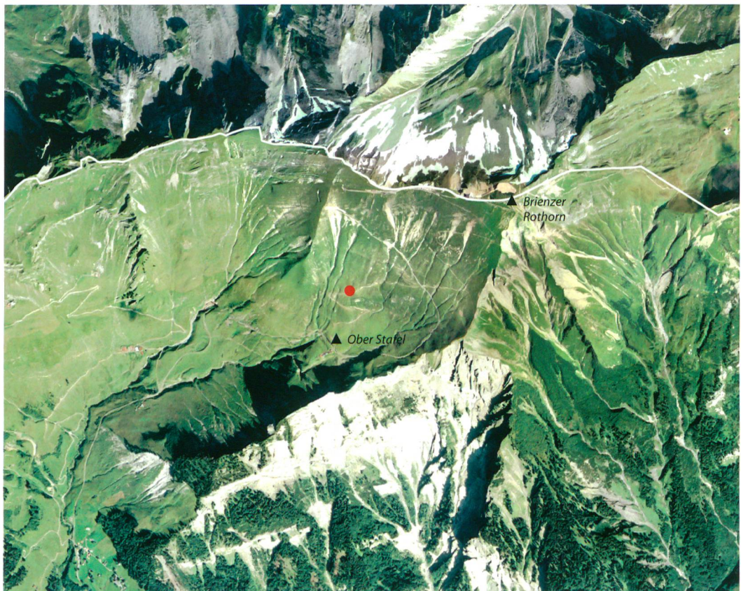
Abb. 1: Brienz, Briener Rothorn, Ober Stafel/Schonegg. Lage der Fundstelle (roter Punkt). M. 1:25 000.

Die Pfeilspitze wurde von den deutschen Feriengästen bei einer Wanderung von Ober Stafel (1818 müM) in Richtung Briener Rothorn (2350 müM) mitten auf dem Wanderweg gefunden (Abb. 2). Es handelt sich um eine trianguläre Pfeilspitze aus Silex mit konkaver