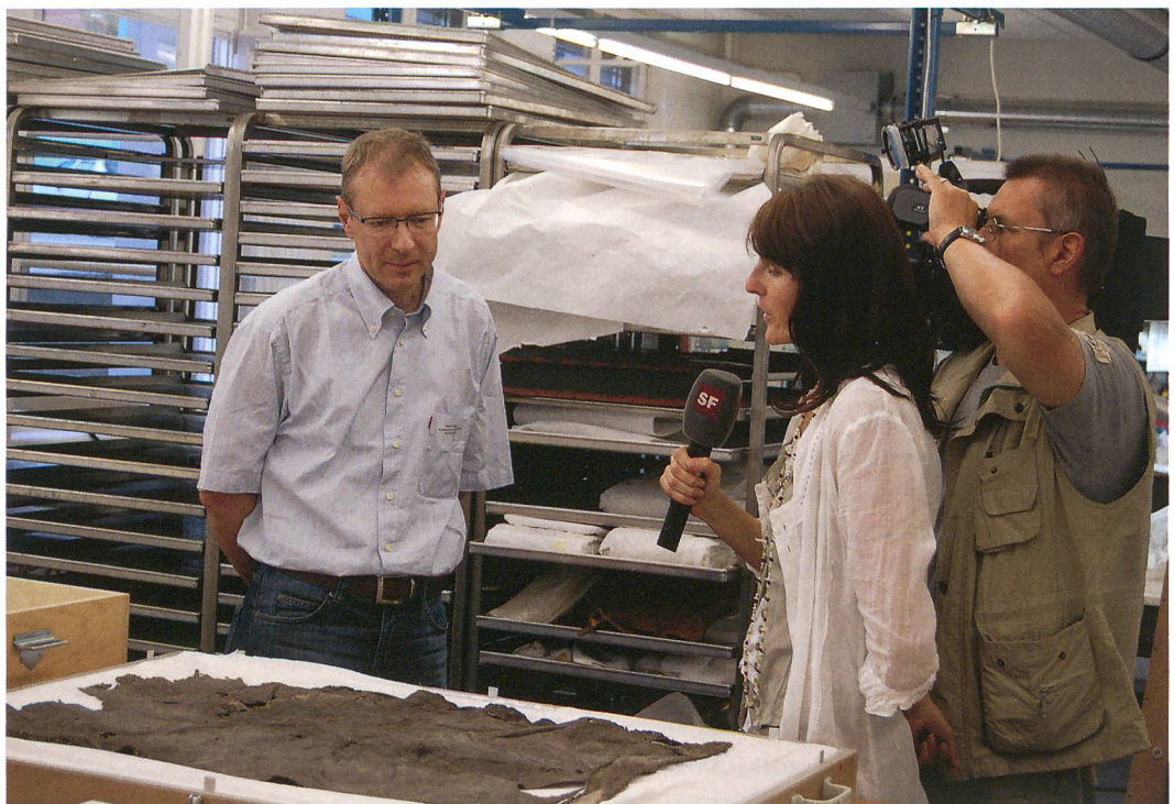
Abb. 5: Lenk, Schnidejoch. Internationales Symposium. SF DRS zu Besuch im Archäologischen Dienst. «Schweiz aktuell» sendete live aus den Räumen an der Brünnenstrasse 66. Die «Tagesschau» und «10 vor 10» berichteten ebenfalls über die archäologische Sensation aus dem Kanton Bern.

Die gemeinsame Medienmitteilung von OCCR und der Kommunikationsstelle des Kantons Bern KomBE zum Symposium wurde von zahlreichen Medien übernommen. Im Mittelpunkt stand dabei die Aussage, dass einzelne Funde von Lenk, Schnidejoch über 1000 Jahre älter sind als die bekannte Gletscherleiche («Ötzi») vom österreichisch-italienischen Tisenjoch. Die nationale Nachrichtenagentur swissinfo.ch verbreitete die Neuigkeit in sechs europäischen Sprachen sowie auf Arabisch, Japanisch und Chinesisch. Andere Nachrichtenagenturen griffen die Meldung auf und deshalb wurde weltweit über dieses Ergebnis der ersten wissenschaftlichen Auswertungen berichtet (Abb. 4). Im Web-Portal Google wurden zeitweise unter dem Begriff «Schnidejoch» über 13000 Einträge gefunden.