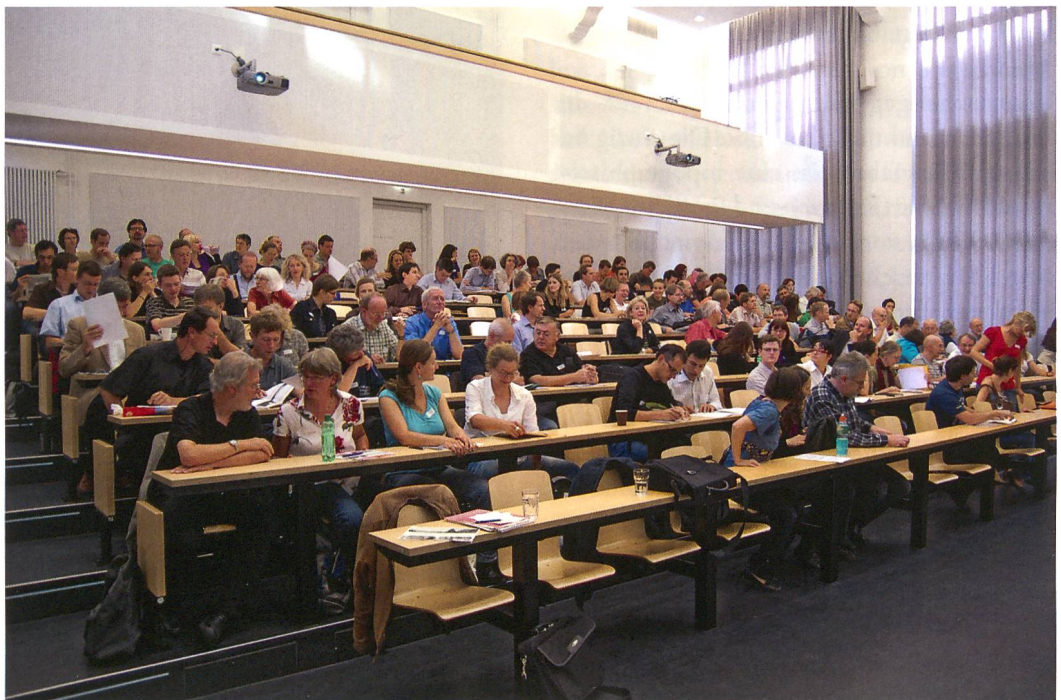
Abb. 1: Lenk, Schnidejoch. Internationales Symposium, Hörsaal A003 im UniS-Gebäude, Schanzeneckstrasse 1 der Universität Bern bot während eineinhalb Tagen ideale Bedingungen für Referenten und 140 Teilnehmer.