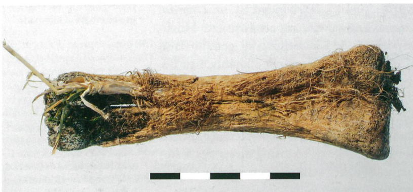
Abb. 3: Brienz-Axalp, Chüemad. Wurzelspuren an einem Rindermetapodium.