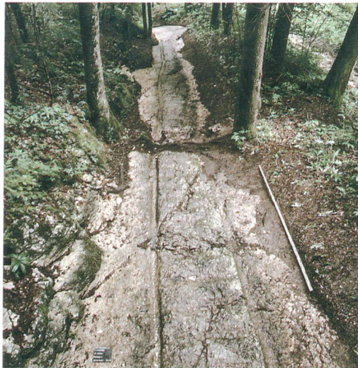
Fig. 1 : Tavannes, La Tanne. Vue du tronçon 2 en direction de l'aval ; la rainure droite est très endommagée.