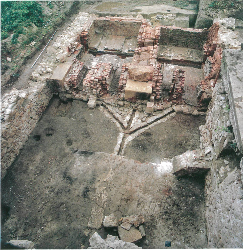
Abb. 4: Sutz-Lattrigen, Ziegelhütte. Blick von Norden auf die Fundamente der beiden Ziegelöfen. Im Vordergrund sind die Kanäle der Ofendrainage freigelegt. Die Entwässerung und Trockenlegung des Ofenuntergrundes war wegen stark drückendem Hangwasser notwendig.

rückwärtigen, hangaufwärts gelegenen Südfassade und der Einbau der beiden Ziegelöfen. Gleichzeitig wurden Teile des Erdgeschosses in Werkstatträume und Teile des Obergeschosses in Wohnräume umgewandelt. Vom eigentlichen Ziegeleigebäude bzw. Schutzbau und Trockenschuppen über den Ziegelöfen haben sich wegen der Umgestaltungen nach 1890/1891 keine Spuren erhalten. Von der Ziegelhütte ist kein Zustand bildlich überliefert. Die einzige Darstellung ist der Urkataster von 1883 (vgl. Abb. 2).