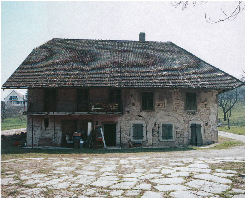
Abb. 1: Sutz-Lattrigen, Ziegelhütte. Der bauliche Zustand des alten Ländtheuses im Jahr 2007. Ansicht von Norden.

Unmittelbar am Ufer des Bieler Sees steht das Ländtheaus von Sutz-Lattrigen (Abb. 1 und 2). Es wurde, nach Jahren des Leerstandes, im Jahr 2007 saniert und einer neuen Nutzung zugeführt. Nach ersten Voruntersuchungen im Jahr 1999 führte der Archäologische Dienst des Kantons Bern seit Anfang 2007 zusammen mit der kantonalen Denkmalpflege archäologische und bauphistorische Untersuchungen durch. Ziel war die Dokumentation der vielfältigen Nutzungsgeschichte des Hauses, die sich sowohl im Boden als auch im aufgehenden Mauerwerk ablesen liess.