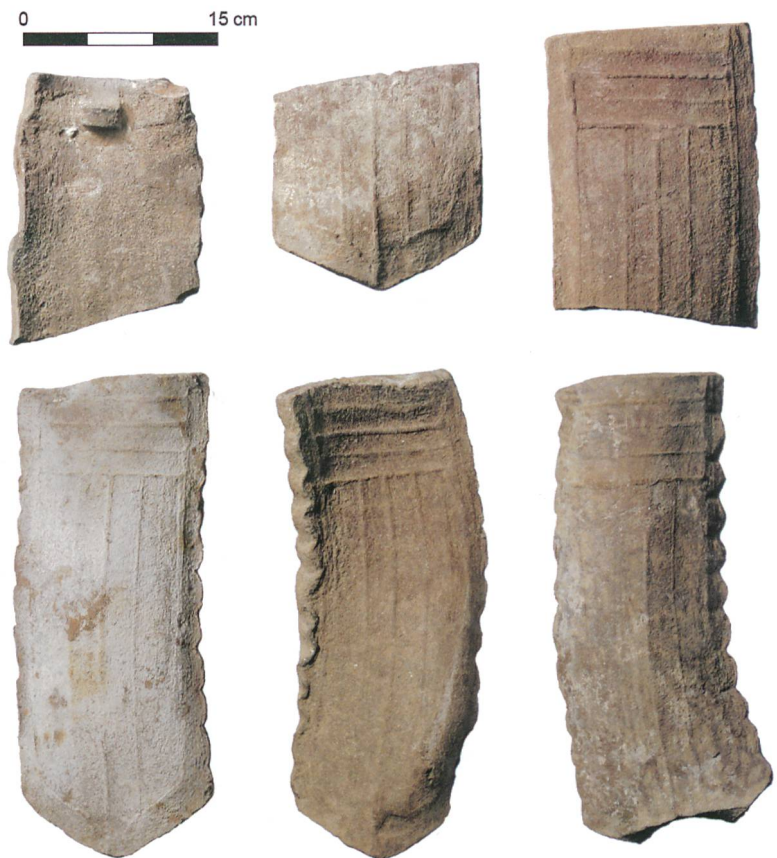
Abb. 5: Sutz-Lattrigen, Ziegelhütte. Fehlbrände von Dachziegeln, wohl Produkte der Ziegelei. Die geringe Zahl der gefundenen Fehlbrände spricht für eine Deponierung der typischen und massenhaft anfallenden Abfälle an anderer Stelle.

Andres Moser, Die Kunstdenkmäler des Kantons Bern. Landband III. Der Amtsbezirk Nidau 2. Teil. Die Kunstdenkmäler der Schweiz 106. Bern 2005.