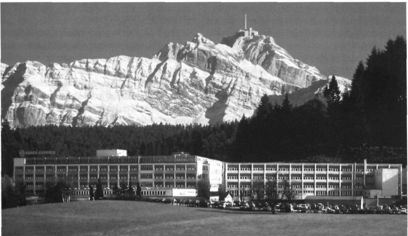
Die grösste Ausserrhoder Industrieunternehmung, die HUBER+SUHNER AG, musste im Verlaufe des Jahres ihren Personalbestand in Herisau um rund 300 Personen reduzieren.

Industrie. Die anhaltende Flaute machte auch vor der Industrie in Ausserrhoden nicht Halt. Sichtbarstes Zeichen dafür waren der Per-