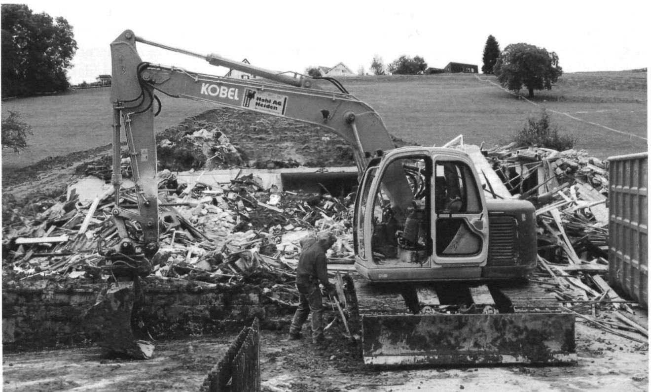
Unwetter richteten im ganzen Kanton grossen Sachschaden an. In Lutzenberg (Bild) geriet ein Hang ins Rutschen und zerstörte ein Einfamilienhaus; drei Personen wurden dabei getötet.

wurde die Unwetterkatastrophe auf den verschiedenen Ebenen gut gemeistert, aus einigen Schwachstellen sollen jedoch die nötigen Lehren gezogen werden. – Im Verlaufe des Jahres haben drei Mitglieder der Regierung angekündigt, dass sie auf Ende Amtsjahr zurücktreten werden: Gebi Bischof (FDP) nach sechs Amtsjahren, Werner Niederer (SP) als amtsältester Regierungsrat nach 14 Amtsjahren, und schliesslich Marianne Kleiner-Schlöpfer (FDP), die drei Jahre auch das Amt des Landammanns inne hatte, nach neun Amtsjahren. Der langjährigen Ausserrhoder Finanzdirektorin ist im übrigen grosse Ehre widerfahren: Sie wurde von der Zeitschrift «Bilanz» zur Finanzdirektorin des Jahres gekürt. – Zwei Jahre hat der Ausserrhoder Landammann Hans Altherr die