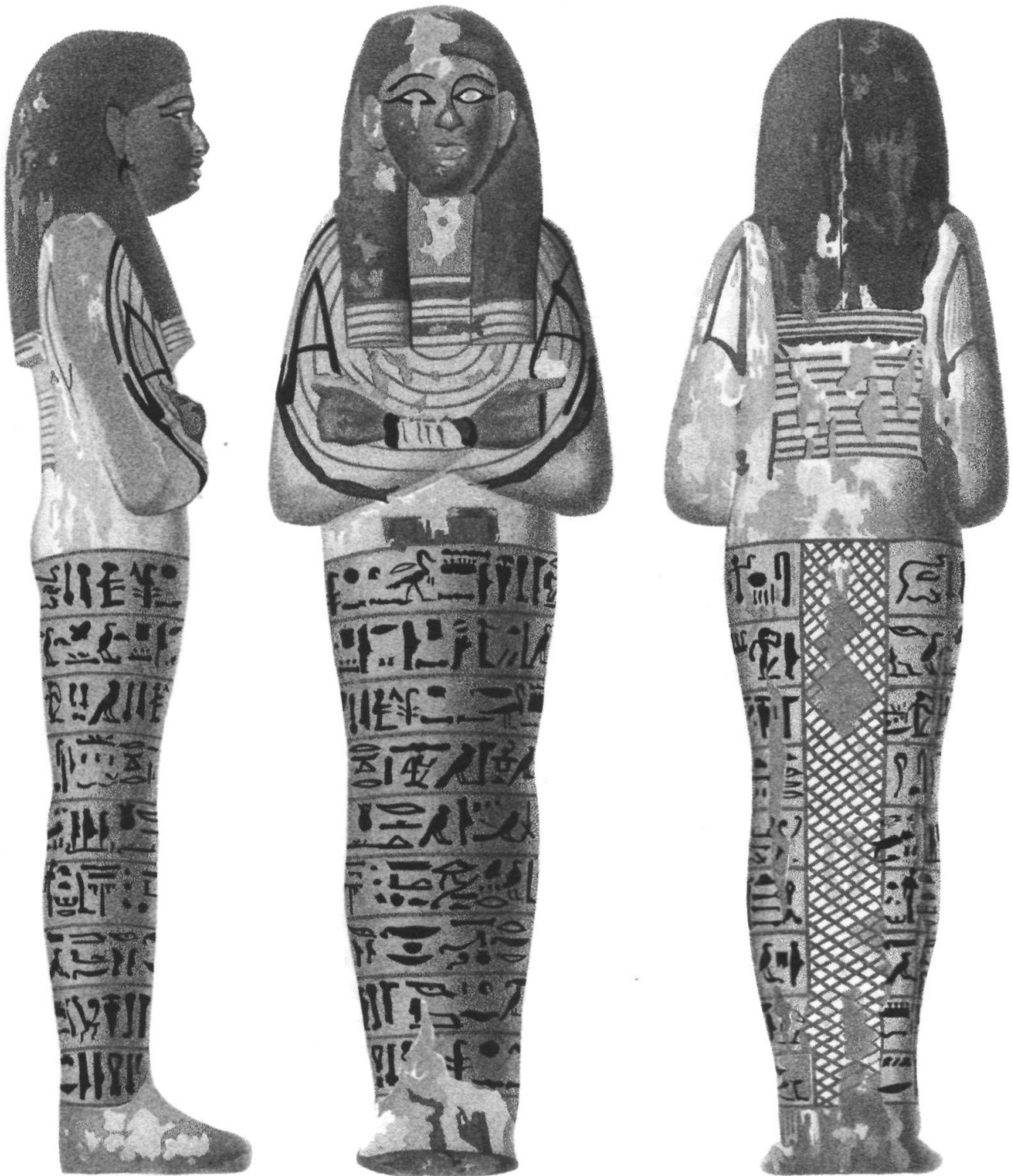
In der «Description de l'Égypte» sind zahlreiche bemalte Sarkophage aus der Gegend von Theben abgebildet.