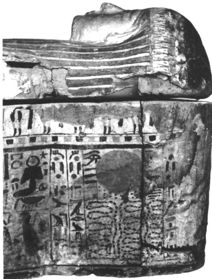
Das Kopfende des Sarges zeigt die rot bemalte Sonnenscheibe im Horizont über der vielfach gewundenen Apothis-Schlange, die immer wieder vom Sonnengott überwunden wird.

Auch der Umstand, dass die Wände in den Massengräbern nicht mehr dekoriert, sondern in rohem Zustand belassen wurden, hat wohl mit dem besseren Schutz des Grabes zu tun. Solange weder Name noch Titel an den Wänden die Sargbesitzer auswies und die Räuber eine Fülle von aufgestapelten Särgen vorfanden, von denen sie nicht wussten, wem die darin ruhenden Mumien gehörten, waren diese relativ sicher. Diese Massenverstecke erwiesen sich als gut gewählt, wurden sie doch zwischen 959 und 935 v. Chr. endgültig versiegelt und erst Ende des letzten Jahrhunderts wieder entdeckt.