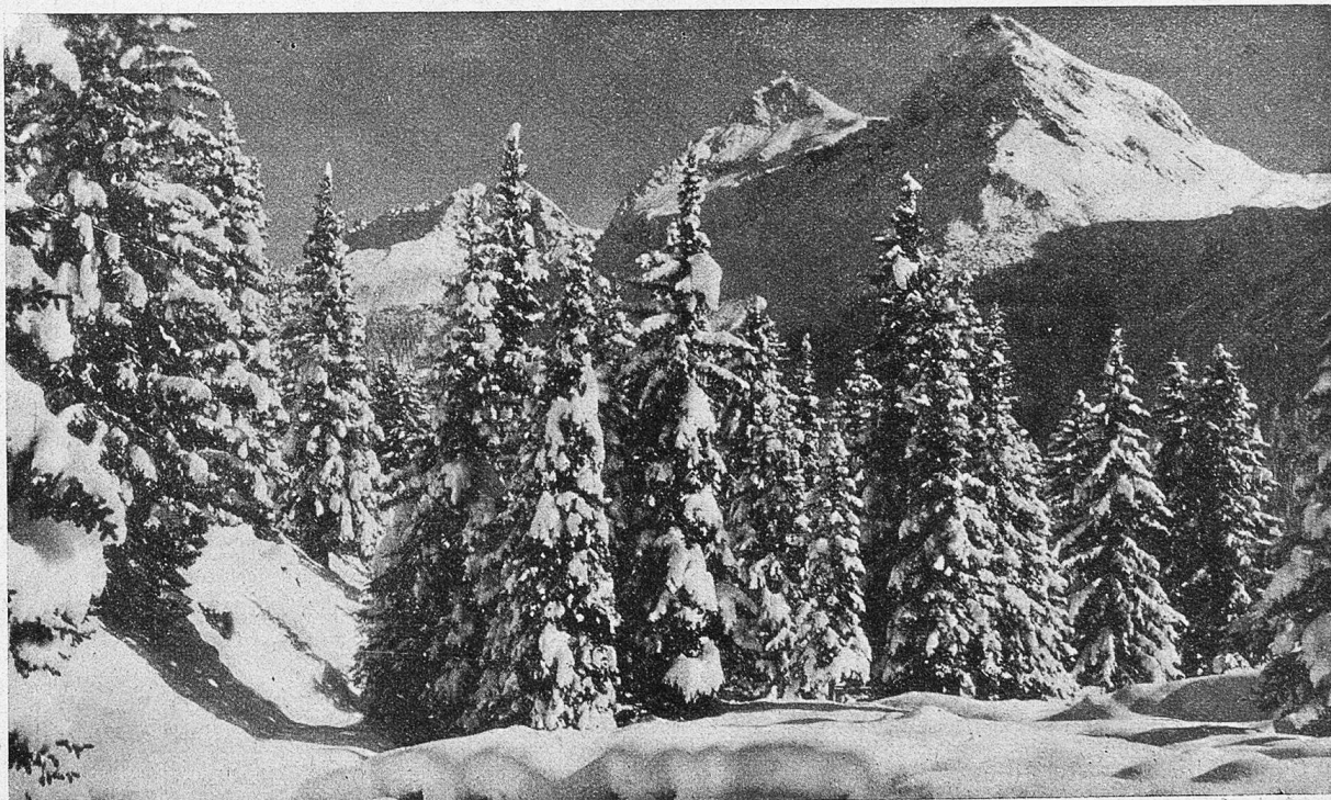
Winterlandschaft bei Arosa.

Mehr besucht als die zwei Berge sind die volkstümlichen Gipfel des Crap la Pala und des Biz Scalottas. Ich habe beide viele Male bestiegen, das erste Mal war es am schönsten, weil ich allein ging. Es war damals mein letzter Ferientag, und meine Tourengefährten waren schon weg. Dieser Tag mußte genutzt werden. Kaum war die Sonne erwacht, als ich auch schon unterwegs war. Dem tiefverschneiten See entlang spürte ich, bis mich der erste Sonnenstrahl erreichte. Wie ruhig und einsam war heute der Wald, wie leicht es sich stieg! Und doch lagen die Gipfel scheinbar noch unendlich hoch über mir. Nach den Alpen Tgantieni und Fopps fielen die Tannen langsam hinter mich zurück, und in einem Bogen nach rechts aussholend, erreichte ich den Sattel zwischen Crap la Pala und Biz