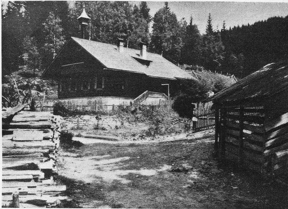
Die Waldschule in Mpl bei Krieglach.