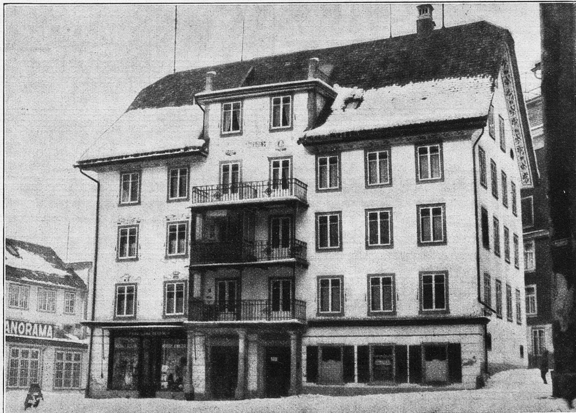
Meinrad Lienerts Geburtshaus zu „Adam und Eva“ in Einsiedeln.

Die Sprache ist nur das Gefäß gewesen, in das er wertvollen Inhalt goß. Mit seiner poetischen Betrachtungsweise hat er alles Menschliche berührt, das einen Menschen aus dem Schwyzerland bewegen konnte. Über diesen Rahmen ist er in seinen Gedichten nie hinausgegangen und hat sich in weiser und einsichtiger Art auf das verhältnismäßig kleine Gebiet beschränkt, das der mundartlichen Literatur zugewiesen ist. Und doch, wie hat er dieses kleine Gebiet ausgeweitet, wie hat er es bis in alle Winkel durchforscht und ihm alle Rätsel und Geheimnisse abgelauscht, die im Herzen wohnen. Und siehe da, dieses Herz ist ihm eine Welt für sich, in der der tiefste Kummer und die lauteste Freude nebeneinander vereinigt sind. Sehnsucht, Glück, Natur, Mensch und Tier, Liebe und immer wieder die Liebe in allen Schattierungen der Hoffnung, der Erfüllung, des Hangens und Bangens, des Sichsuchens und Sichfindens bis zum tragischen Schicksal des Verlustes und Fortsetzung siehe Seite 278.