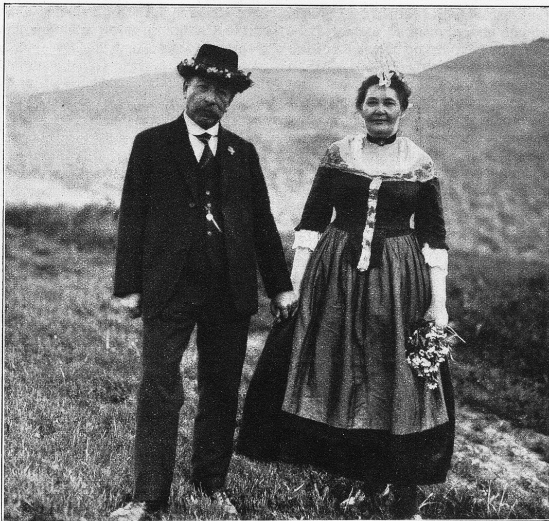
Der Dichter Meinrad Lienert mit seiner Gattin, am 60. Geburtstag.

Dialekt an die Seite gesetzt werden. Auf Schritt und Tritt und ganz besonders bei dem anmutigen Schneckenegeschichtlein fühlt man sich an den Wiesentaler Johann Peter Hebel erinnert. Und in der Tat! Der Vergleich ist lohnend. Zwei Naturen stehen einander gegenüber, die bei manchen und großen Verschiedenheiten doch innig verwandt sind. Sie teilen das ungewöhnlich starke Heimatgefühl. Ganz aus dem Volke herausgewachsen, ist ihnen nur wohl in ihrem Jugendland. Die Sehnsucht darnach, nach allen ländlichen Reizen und himeligen Tönen macht sie zum Dichter. Hebel muß ins Oberland reisen, „aus der Wiese trinken und die Geister im Rötler Schloß besuchen“, wenn er „nicht in kurzer Zeit zu den gemeinsten, geistlosesten Naturen ermatten soll.“ Meinrad Lienert singt über zwanzig innige Heimwehlieder. Was sie scheidet, ist das Temperament. In Hebels Wesen spiegelt sich das ruhige, freundliche Wiesental, die Wiese selbst, die gemächlich, nachdenklich grü-