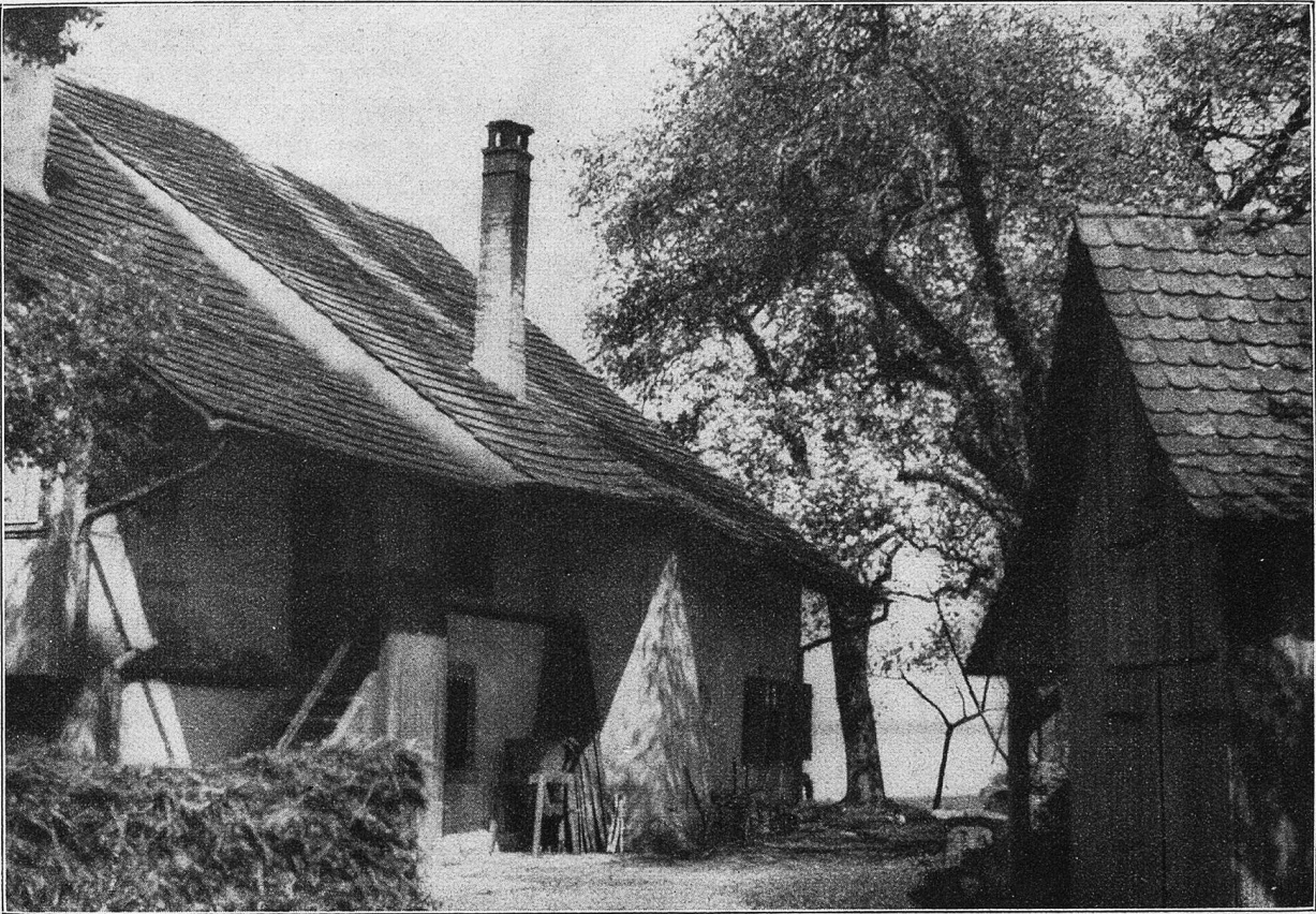
Fischer- und Bauernhaus in Ermatingen.