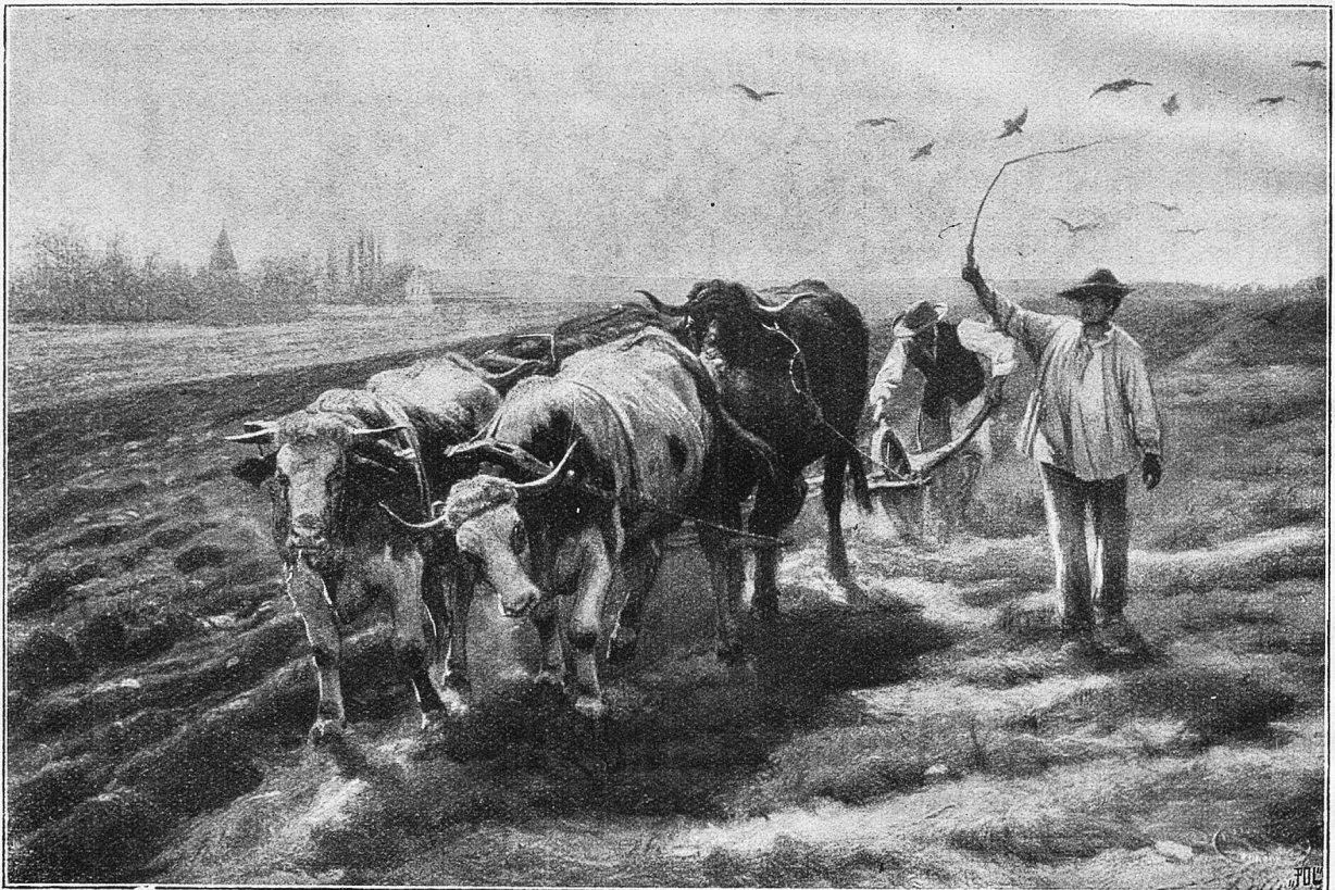
Rudolf Koller: Pflügende Ochsen.

So tat der Umgang und die Berührung mit anders gerichteten Geistern Koller sehr wohl, und er freute sich, von andern Künsten und Wissensgebieten her manche Belehrung und Anregung zu erhalten. In der kleinen Künstlergesellschaft, die er selber hatte begründen helfen, trafen sich allwöchentlich Geiger, Sänger, Klavierspieler und Dichter. Auch mit Jakob Burckhardt wurde Koller bekannt, mit dem