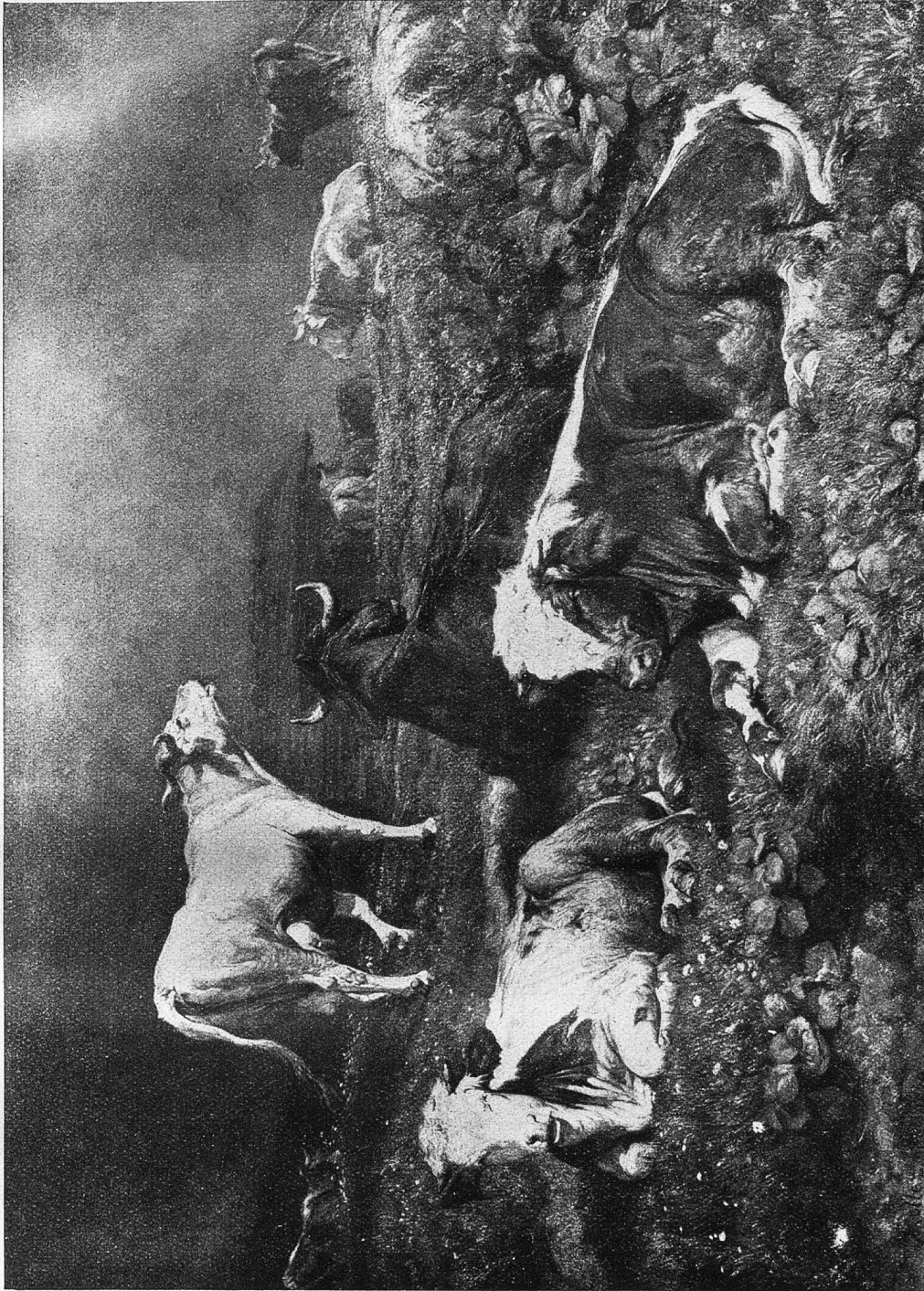
Rudolf Koller: Gerwitter auf der Alp.