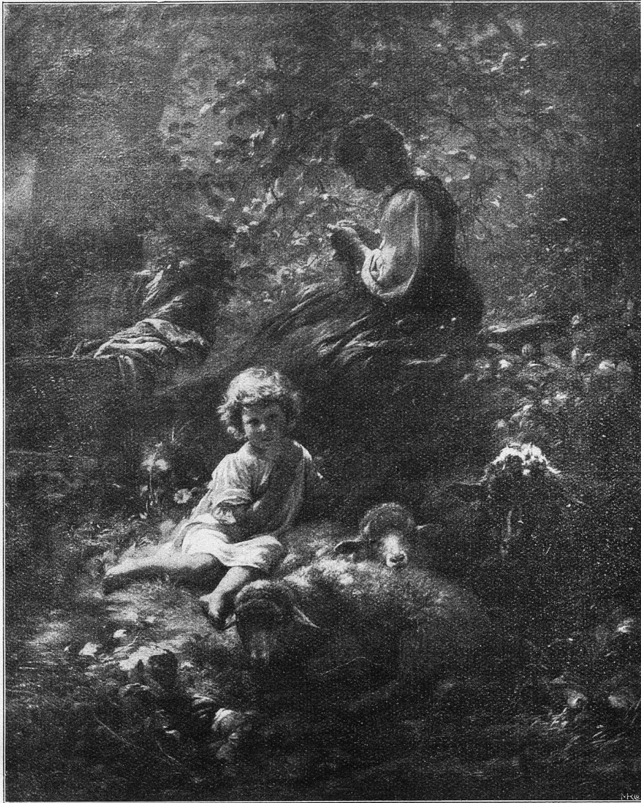
Rudolf Koller: Kinder mit Schafen.