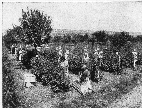
Himbeerpflücker in Hallau.

sind, wie sich dies von selbst aus den Mengen der zur Verarbeitung kommenden Rohmaterialien ergibt.