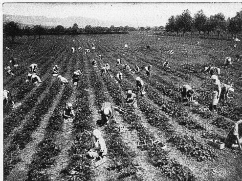
Abernten eines Erdbeerfeldes in Hallau.